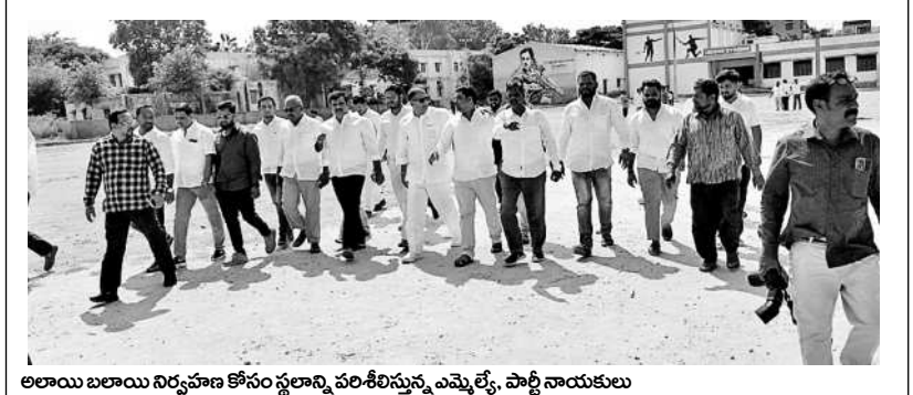
అలాయి బలాయి నిర్వహణ కోసం స్థలాన్ని పరిశీలిస్తున్న ఎమ్మెల్యే, పార్టీ నాయకులు