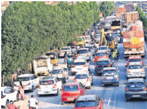
చౌటుప్పల్ పట్టణంలో హైవేపై వాహనాల రద్దీ