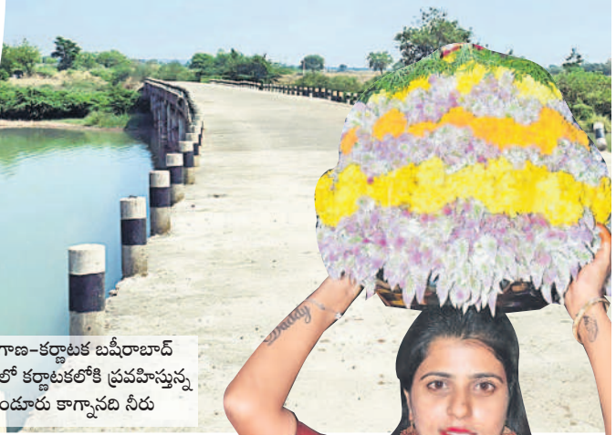
తెలంగాణ-కర్ణాటక బహిరూపాద్ సమీపంలో కర్ణాటకలోకి ప్రవహిస్తున్న తాండూరు కాగానది నీరు

ఉమ్మడి జిల్లాలో ఆదివారం సద్దుల బతుకమ్మ సంబురాలు అంబరా న్నంటాయి. మహిళలు గౌరవ్యుకు పూజలు చేసి గ్రామాల్లోని ప్రధాన కూడళ్ల వద్ద బతుకమ్మలను ఉంచి 'చిత్తూ చిత్తూల బొమ్మ... శివుని ముద్దాల గుమ్మ', 'ఏమేమి పువ్వుప్పనే గౌరవ్యు... ఏమేమి కాయె పువ్వునే గౌరవ్యు... అంటూ ఆడిపాడారు. రంగురంగుల పూలతో చేసిన బతుకమ్మలు చూపరులను ఆకట్టుకున్నాయి. చిన్నారులు పటాకులు కాల్పుతూ సందడి చేశారు. అనంతరం బతుకమ్మలను గ్రామాల సమీపంలోని చెరువుల్లో నిమజ్జనం చేసి, ఒకరికొకరు వాయిదాలను ఇచ్చి పుచ్చుకున్నారు.