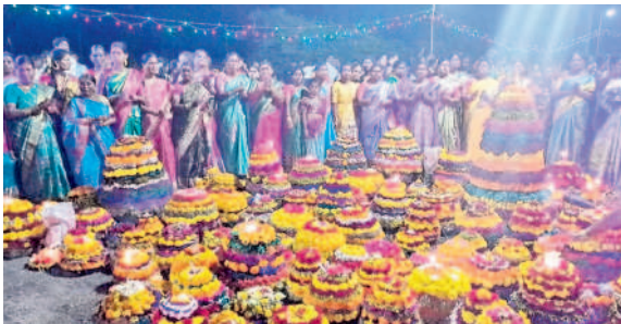
నల్లబెల్లి: మండలకేంద్రంలో బతుకమ్మ ఆడుతున్న మహిళలు