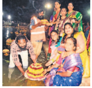
నర్భంపేటలో బతుకమ్మలను నిమజ్జనం చేస్తున్న మహిళలు

దేవుళ్ల ఎదుట ఉంచి కుటుంబ సమే తంగా గౌరీపూజ చేశారు. సాయంత్రం వేళ.. ఆడబిడ్డలు సంప్రదాయ దుస్తులు ధరించి గ్రామాలు, పట్టణాల్లో ఏర్పాటు చేసిన ఆట స్థలాల వద్దకు చేరుకు న్నారు. బతుకమ్మలను ఒకచోట చేర్చి ಮಪಿಳಲು ನಾಮಾಪಿಕಂಗಾ చುಟ್ಟಾ తిరుగుతూ కోలాటం ఆడుతూ.. బతు కమ్మ పాటలు పాడుతూ సందడి చేశారు. రాత్రి వరకు ఆడిపాడిన అనం తరం చెరువులు, కుంటల్లో బతుకమ్మ లను నిమజ్జనం చేశారు. తర్వాత ముత్త యిదవులు వాయినాలు ఇచ్చిపుచ్చు కొని ఆనందోత్సాహాల మధ్య ఇండ్లకు చేరుకున్నారు. ఈ సందర్భంగా గ్రామ పంచాయతీలు, మున్సిపాలిటీల ఆధ్వ ర్యంలో ఘనంగా ఏర్పాట్లు చేశారు. ఇందులో భాగంగా నర్పంపేట పట్టణంలోని అంగడి మైదానంలో ఫ్లడ్ లైట్లు, విద్యుత్ వెలుగుల మధ్య వేడుకలను మహిళలు