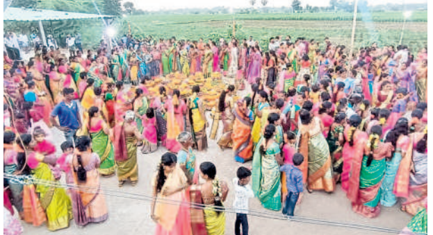
నర్సంపేటరూరల్ : మండలంలోని భాంజీపేటలో బతుకమ్మ ఆడుతున్న ఆడబిడ్డలు, నర్సంపేటలో.

చెన్నారావుపేట: మండలకేంద్రంలో బతుకమ్మ ఆడుతున్న మహిళలు