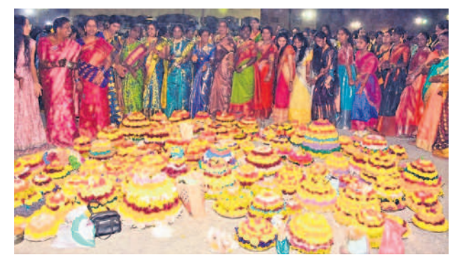
నర్సంపేటలో బతుకమ్మ ఆడుతున్న మహిళలు

ADVOCATES, H.No. 1-8-489, Haritha Residency, Balasamı