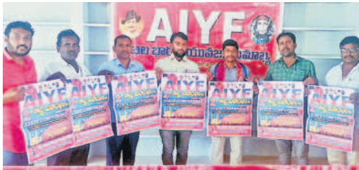
ఏఐవైఎఫ్ రాష్ట్ర మహాసభల వాల్ పోస్టర్లను ఆవిష్కరిస్తున్న నాయకులు