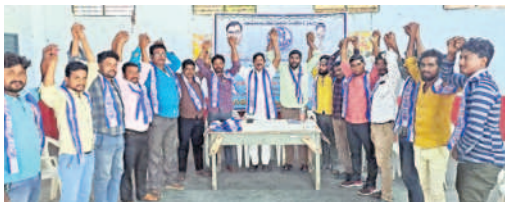
సమావేశంలో బేడ బుడిగ జంగాల ఐక్యతను తెలుపుతున్న నాయకులు