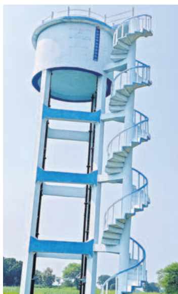
ఓవర్ హెడ్ ట్యాంక్