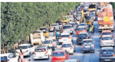
చౌటుప్పల్ పట్టణంలో హైవేపై వాహనాల రద్దీ