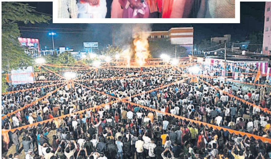
ఆదిలాబాద్ జిల్లా కేంద్రంలోని రాంలీలా మైదానంలో దసరా సందర్భంగా రావణ దహనం