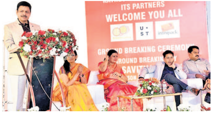
ప్రతినిధుల సమావేశంలో మాట్లాడుతున్న సీపీ చౌదూరి

ఫాక్స్ కాన్ తరహాలో కేన్స్ సెమికాన్.. - రూ.3000కోట్లతో స్థాపించనున్న పరిశ్రమ.. - త్వరలో ఎలిమినేషన్ లో మరో ఎలక్ట్రానిక్ పరిశ్రమ..