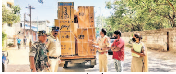
ఆర్యోధరం చెక్పోస్టులో తనిఖీలు నిర్వహిస్తున్న కేంద్ర సాయుధ బలగాలు, పోలీస్ సిబ్బంది