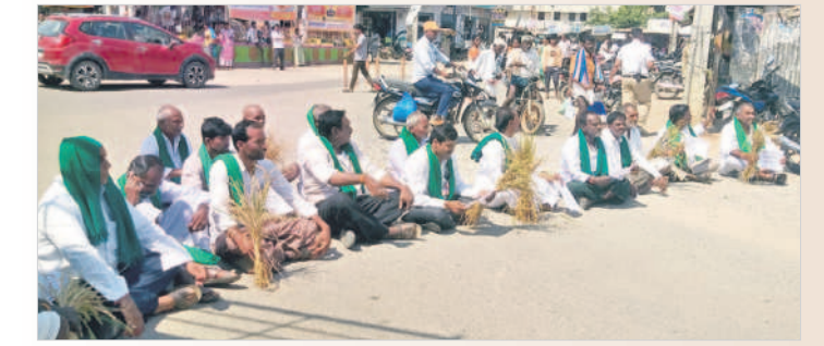
కాంగ్రెస్ కు ఓటు వేయవద్దంటూ ప్లకార్డులు ప్రదర్శిస్తూ రోడ్డుపై బైరాయింబిన కర్షకుల రైతులు