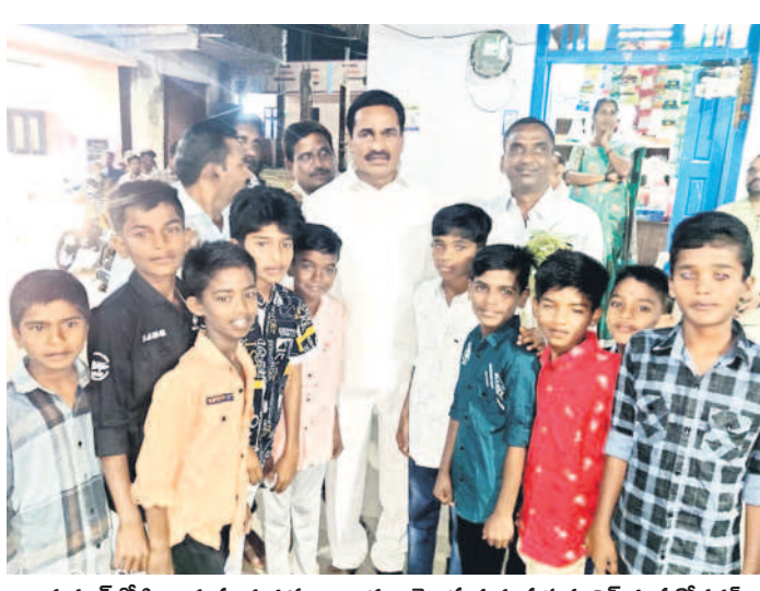
భక్తనూర్లో పిల్లలకు పండుగ శుభాకాంక్షలు తెలుపుతున్న ప్రభుత్వ వివే గంప గోవర్ధన్