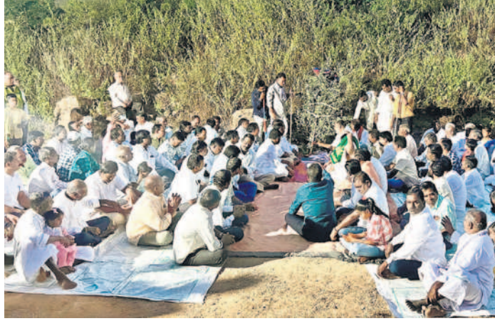
ఇందల్యాంలలో శమి పూజలు నిర్వహిస్తున్న గ్రామస్తులు