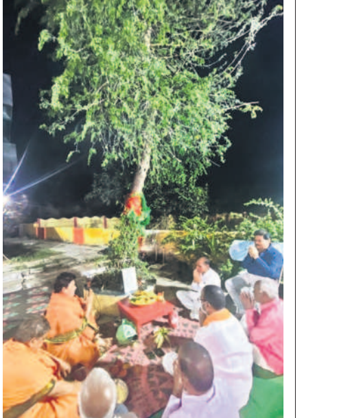
నిజామాబాద్లో శమి పూజలు నిర్వహిస్తున్న పండుగ