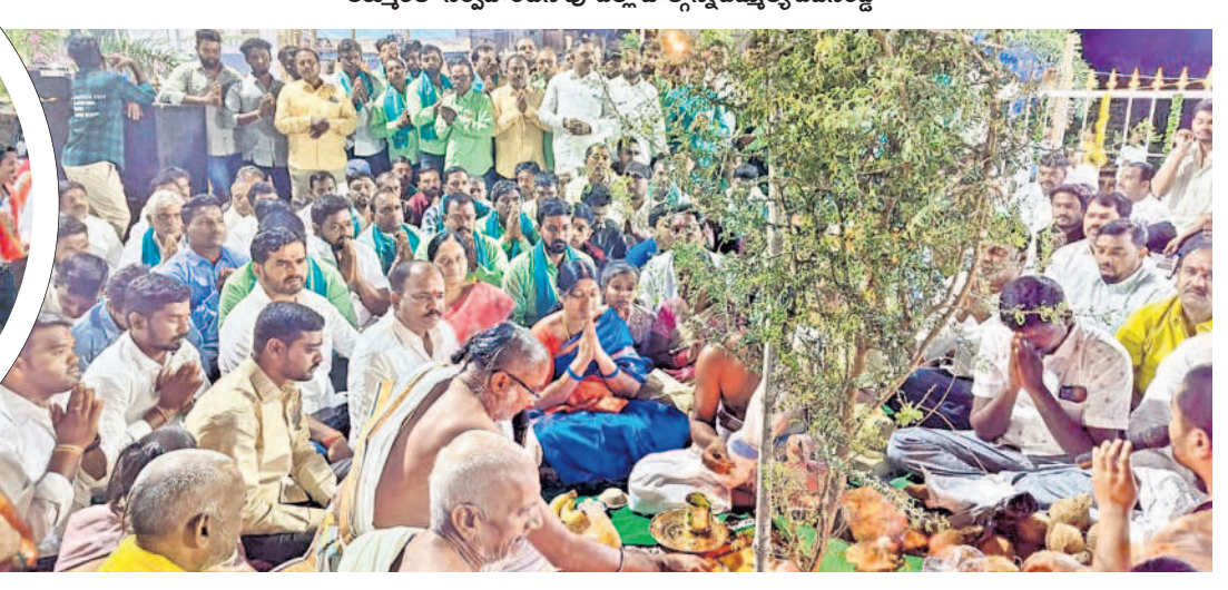
భీమగల్ పట్టణంలో జమ్మి చెట్టుకు పూజలు నిర్వహిస్తున్న ప్రజాప్రతినిధులు, పుర ప్రజలు