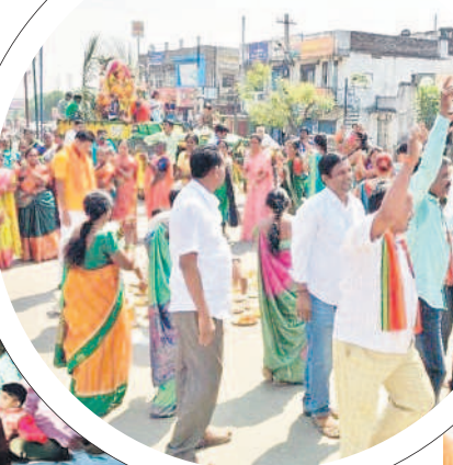
ఆర్కూర్లో దేవీమాత శోభాయాత్ర నిర్వహిస్తున్న ప్రజలు