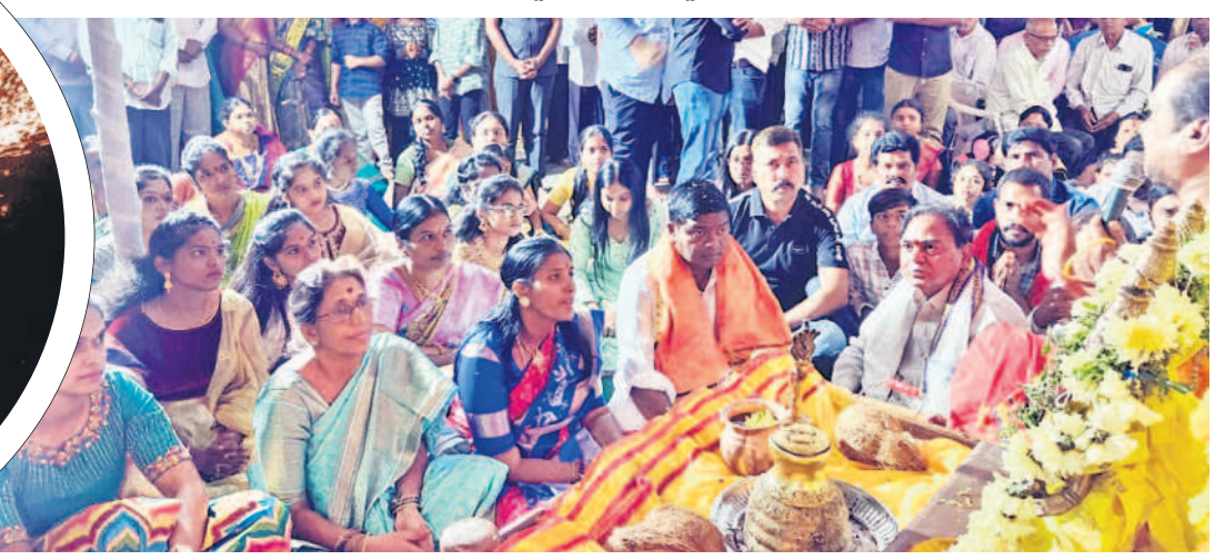
ఆర్కూర్లో నిర్వహించిన పూజల్లో పాల్గొన్న ఎమ్మెల్యే జీవనరెడ్డి