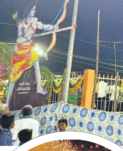
భీమగల్ పట్టణంలో రావణ దిష్టిబొమ్మ వధ

వైభవంగా శమి పూజలు • జనం మధ్య పండుగ జరుపుకొన్న ప్రజాప్రతినిధులు, నేతలు దసరా పండుగను ఉమ్మడి జిల్లా ప్రజలు ఘనంగా జరుపుకున్నారు. సోమవారం విజయదశమిని పురస్కరించుకొని ఆలయాల్లో ప్రత్యేక పూజలు చేశారు. జమ్మి చెట్టుకు పూజలు నిర్వహించి ఒకరికొకరు ఇచ్చిపుచ్చుకుంటూ పండుగ శుభాకాంక్షలు తెలుపుకున్నారు. పలు పట్టణాలు, గ్రామాల్లో రావణ దిష్టిబొమ్మల వధ నిర్వహించారు. ఈ కార్యక్రమాల్లో ఉమ్మడి జిల్లాకు చెందిన ప్రజాప్రతినిధులు, నాయకులు పాల్గొన్నారు.