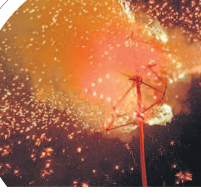
బాన్సువాడలో వటకుల వెలుగులు..

వైభవంగా శమి పూజలు • జనం మధ్య పండుగ జరుపుకొన్న ప్రజాప్రతినిధులు, నేతలు దసరా పండుగను ఉమ్మడి జిల్లా ప్రజలు ఘనంగా జరుపుకున్నారు. సోమవారం విజయదశమిని పురస్కరించుకొని ఆలయాల్లో ప్రత్యేక పూజలు చేశారు. జమ్మి చెట్టుకు పూజలు నిర్వహించి ఒకరికొకరు ఇచ్చిపుచ్చుకుంటూ పండుగ శుభాకాంక్షలు తెలుపుకున్నారు. పలు పట్టణాలు, గ్రామాల్లో రావణ దిష్టిబొమ్మల వధ నిర్వహించారు. ఈ కార్యక్రమాల్లో ఉమ్మడి జిల్లాకు చెందిన ప్రజాప్రతినిధులు, నాయకులు పాల్గొన్నారు.