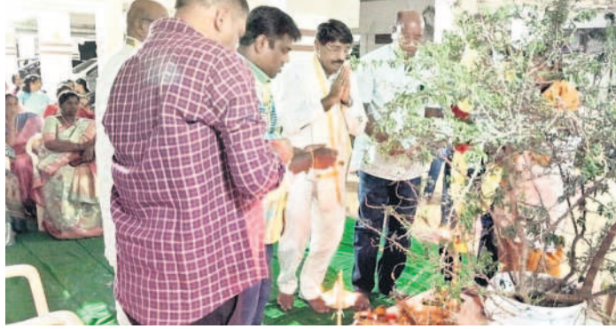
నిజామాబాద్లో జంబు చెట్టుకు పూజలు నిర్వహిస్తున్న జడ్పీ చైర్మన్ దాదన్నగారి విరల రావు