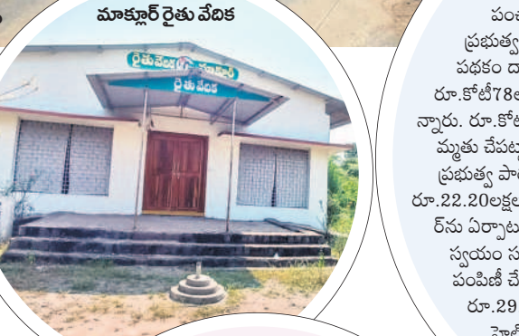
మాక్లూర్ రైతు వేదిక

సంఘ భవనాలు.. ఘంక్షన్ హాళ్లు.. మండల కేంద్రంలో రూ.కోటి 32 లక్షలతో సంఘ భవనాలు నిర్మిస్తున్నారు. రూ.25 లక్షలతో మైనాద్రిలకు పోడి భాన, రూ.10 లక్షలతో చర్చి నిర్మాణం, ఎస్సీ మాదిగ, మూల, దళిత మహిళా భవనం, బాయ్స్ హాస్టల్ మరమ్మత్తులు, మహిళా భవనం, పశువుల దవాఖాన, యాదవ సంఘం, నాయాట్రా హాలు సంఘం, మహిళా సంఘం బ్యాండ్స్ వర్క్, సర్కరీ నిర్మాణం, తెలంగాణ క్రీడా ప్రాంగణం, పల్లె ప్రకృతి వనం, రైతు వేదిక, కమ్యూనిటీ సంఘం, ట్రాక్టర్ ట్రాలీ కొనుగోలు, డంపింగ్ యార్డు నిర్మాణం, వైకుంఠ దామం తదితరవాటి పనులు పూర్తయ్యాయి.