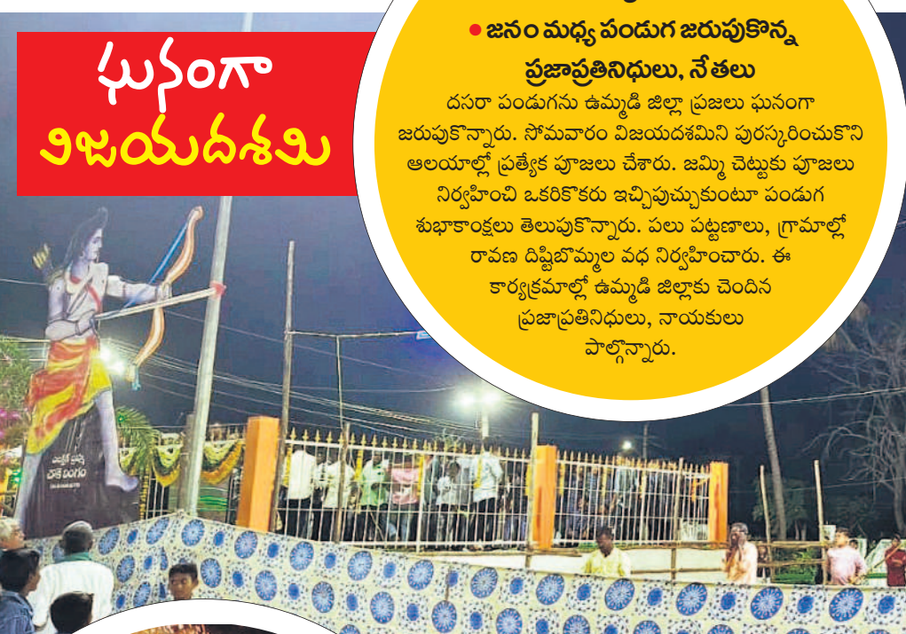
భీమగల్ పట్టణంలో రావణ దిష్టిబొమ్మ వధ