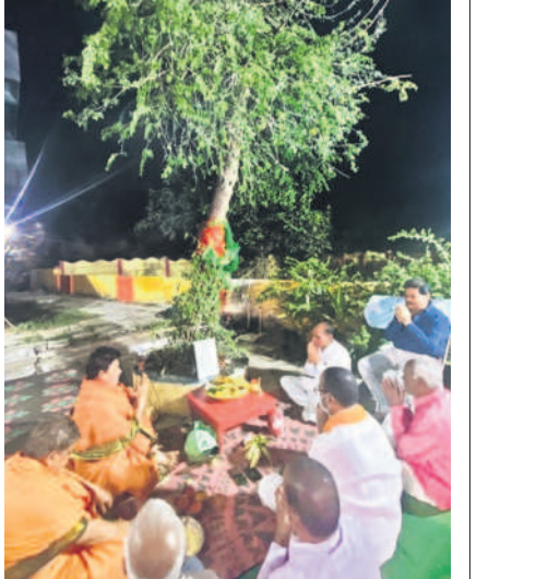
నిజామాబాద్లో శమి పూజ నిర్వహిస్తున్న పండ్లతులు