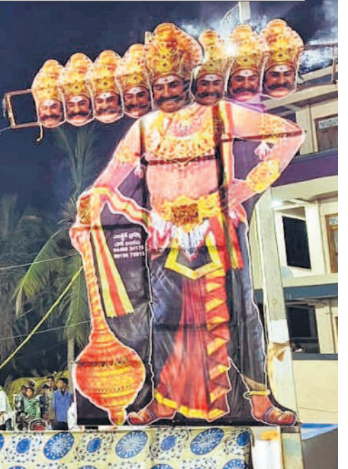
భీమగల్ పట్టణంలో రావణ దిష్టిబొమ్మ వధ