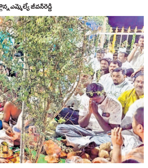
భీమగల్ పట్టణంలో జమ్మి చెట్టుకు పూజలు నిర్వహిస్తున్న ప్రజలు

• వైభవంగా శమి పూజలు • జనం మధ్య పండుగ జరుపుకొన్న ప్రజాప్రతినిధులు, నేతలు దసరా పండుగను ఉమ్మడి జిల్లా ప్రజలు ఘనంగా జరుపుకున్నారు. సోమవారం విజయదశమిని పురస్కరించుకొని ఆలయాల్లో ప్రత్యేక పూజలు చేశారు. జమ్మి చెట్టుకు పూజలు నిర్వహించి ఒకరికొకరు ఇచ్చిపుచ్చుకుంటూ పండుగ శుభాకాంక్షలు తెలుపుకున్నారు. పలు పట్టణాలు, గ్రామాల్లో రావణ దిష్టిబొమ్మల వధ నిర్వహించారు. ఈ కార్యక్రమాల్లో ఉమ్మడి జిల్లాకు చెందిన ప్రజాప్రతినిధులు, నాయకులు పాల్గొన్నారు.