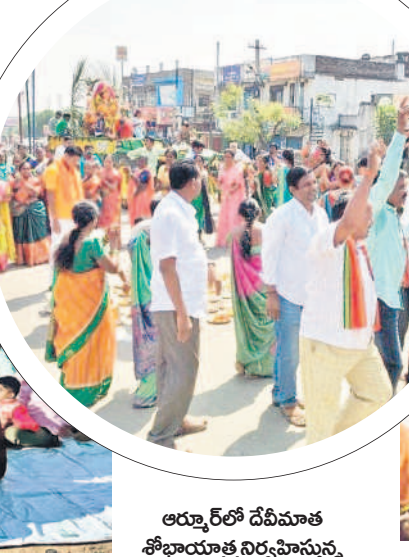
అర్నూర్లో దేవీమాత శోభాయాత్ర నిర్వహిస్తున్న ప్రజలు