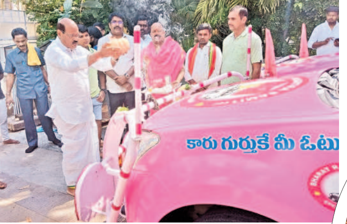
వాహన పూజ చేస్తున్న దూరల్ ఎమ్మెల్యే బాజరెడ్డి గోవర్ధన్, జడ్పీటీసీ బాజరెడ్డి జగన్