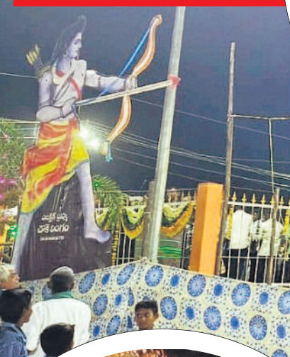
అర్నూర్లో దేవీమాత శోభాయాత్ర నిర్వహిస్తున్న ప్రజలు