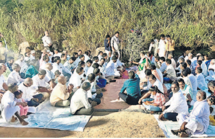
ఇందల్యాండ్లో శమి పూజలు నిర్వహిస్తున్న గ్రామస్థులు