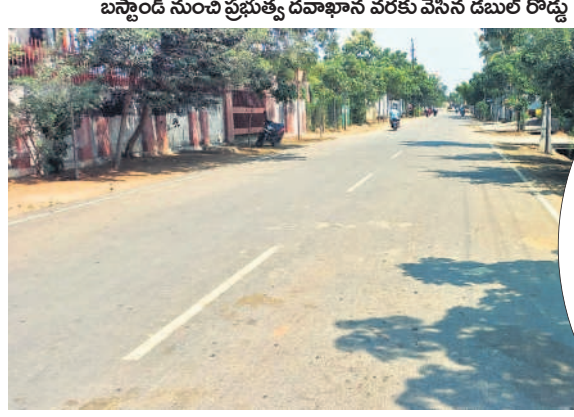
బస్సాండ్ నుంచి ప్రభుత్వ దవాఖాన వరకు వేసిన డబుల్ రోడ్డు