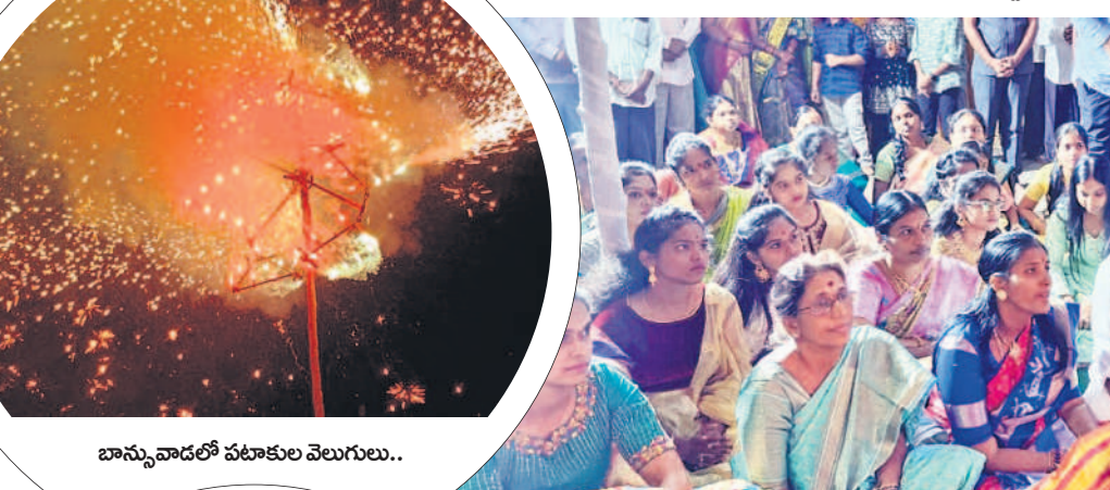
బాన్సువాడలో పట్టుకు వెలుగులు..