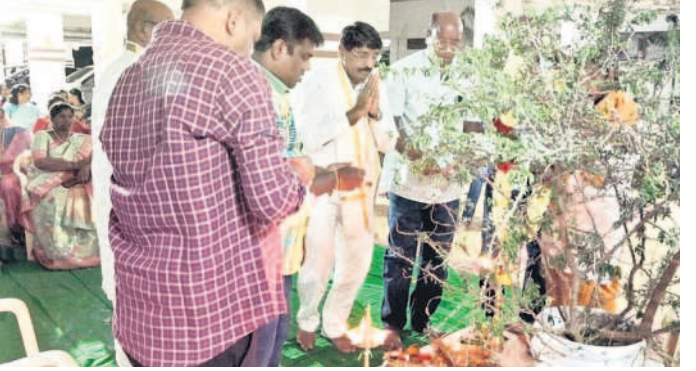
నిజామాబాద్లో జంబు చెట్టుకు పూజలు నిర్వహిస్తున్న జడ్పీ చైర్మన్ దాదన్నగారి విరల రావు