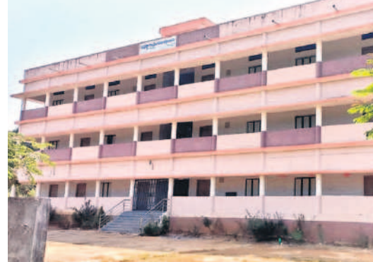
కస్తూర్బా గాంధీ విద్యాలయం

మండల కేంద్రానికి మంజూరైన కస్తూర్బా గాంధీ బాలికల విద్యాలయానికి రూ.కోటి50లక్షలతో భవనాలు నిర్మించారు. 10వ తరగతి పూర్తికాగానే విద్యార్థులకు నేరుగా ఆడిషన్లు కల్పించి ఉన్నత విద్యను అందిస్తున్నారు. గ్రామంలో శిథిలావస్థకు చేరుకున్న పాఠశాలను తొలగించి దానిస్థానంలో రూ.4కోట్ల 50లక్షలు విద్యాశాఖ మంజూరు చేయడంతో కార్పొరేట్ తరహాలో ఉన్నత, ప్రాథమిక పాఠశాల భవనాల నిర్మాణ పనులు శరవేగంగా కొనసాగుతున్నాయి. పోటీ పరీక్షలకు సన్నద్ధమయ్యే అభ్యర్థుల కోసం రూ.17.50లక్షలతో నూతన గ్రంథాలయాన్ని నిర్మించారు.