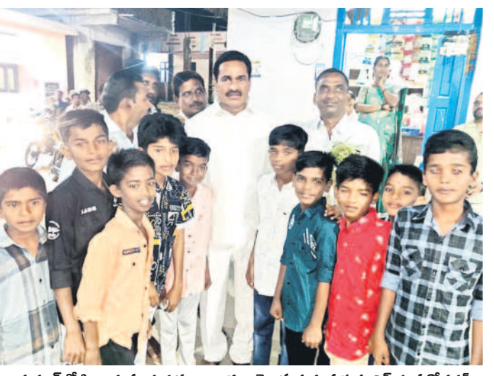
భక్తులలో పిల్లలకు పండుగ శుభాకాంక్షలు తెలుపుతున్న ప్రభుత్వ వివేక గంప గోవర్ధన్