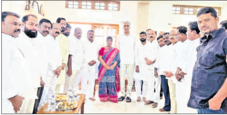
మంత్రి హరిశ్చంద్రను కలిసిన సర్పంచి నిర్మల దావి, బీఆర్ఎస్ నాయకులు

సంగారెడ్డి, అక్టోబర్ 24: సంగారెడ్డి గడ్డపై బీఆర్ఎస్ జెండాను ఎగురవేయాలని, నాయకులందరూ కలిసి కట్టుగా పని చేయాలని ఆర్థిక, వైద్యారోగ్య శాఖల మంత్రి హరిశ్చంద్ర అన్నారు. దసరా తర్వాత నిర్వహిస్తున్న అలయ బలయ కార్యక్రమానికి నారాయణపేట వెళ్తున్న మంత్రి హరిశ్చంద్ర మార్గము ద్వారా డీసీసీటీ వైస్ చైర్మన్ పట్నం మాణిక్యమేకుల రావడంతో మంత్రికి మాణిక్యమే దసరా కుబాకాంక్షలు తెలిపారు. మంగళవారం పట్నం మాణిక్యం నివాసంలో మీడియా సమావేశం ఏర్పాటు చేసి మాట్లాడారు. ఈ సందర్భంగా మంత్రి మాట్లాడుతూ నారాయణపేట నిర్వహిస్తున్న అలయ బలయ కార్యక్రమానికి వెళుతూ మార్గంలో పట్నం మాణిక్యమే నివాసానికి వచ్చి కుటుంబం