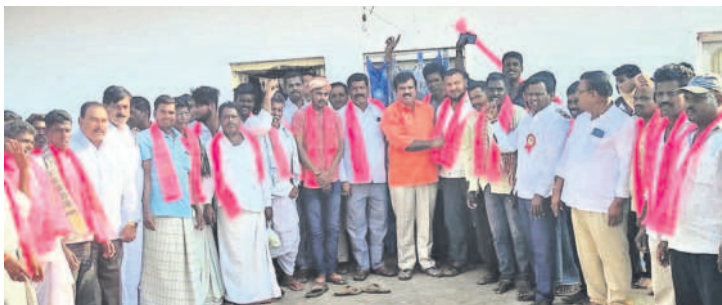
రాయికోడ: బీఆర్ఎస్ లో చేరిన వారికి కండువలు కప్పి ఎమ్మెల్యే చంటి క్రాంతికిరణ్

మెంబర్ అబె దాలి, వీరభద్ర శ్వరస్వామి అలయ కమిటీ