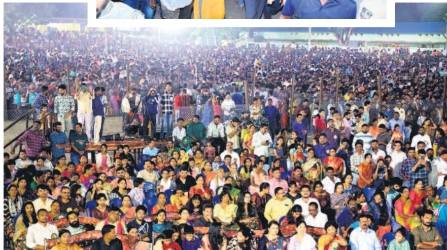
మందమలలో రాలీలా తిలకించేందుకు వచ్చిన ప్రజలు