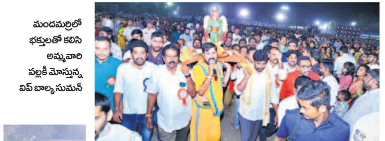
మందమలలో భక్తులతో కలిసి అమ్మవారి పల్లకీ మోస్తున్న విప్ బాల్యసుమన్