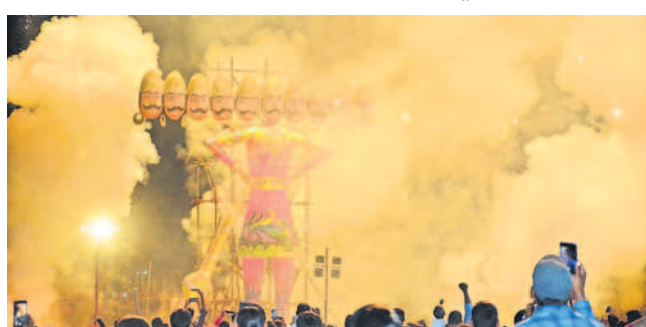
బిన్నవడేపల్లి చెరువు సమీపంలో దహనమవుతున్న రావణుడి ప్రతిమ