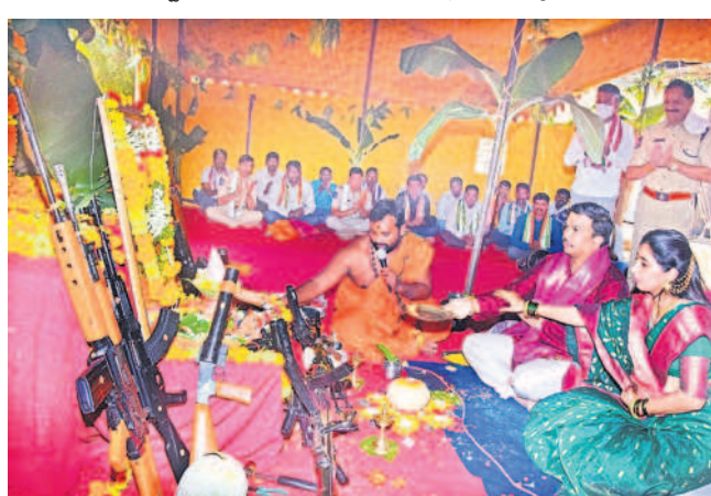
మానుకోట జిల్లా పోలీస్ కార్యాలయంలో ఆయుధ పూజ చేస్తున్న ఎన్టీ కుటుంబ సభ్యులు