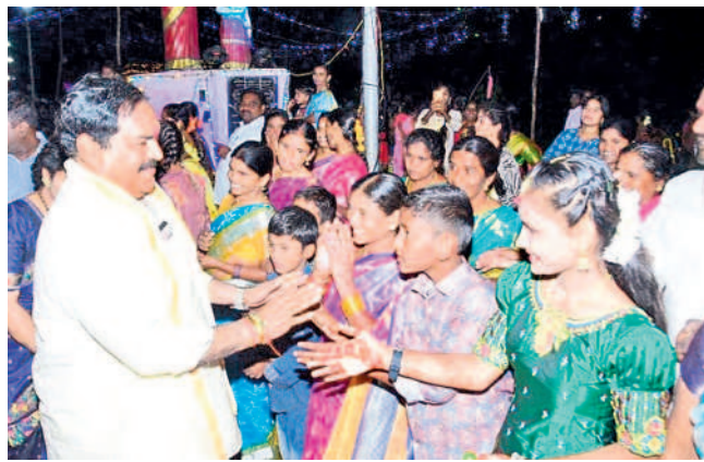
స్థానికులకు దసరా శుభాకాంక్షలు తెలుపుతున్న మంత్రి ఎర్రబెల్లి దయాకర్ రావు