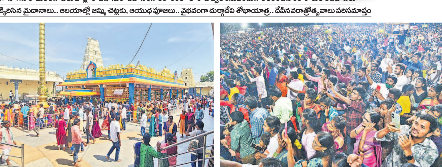
హనుమకొండ పద్మాక్షి గుట్ట వద్ద రామలీల కార్యక్రమానికి హాజరైన ప్రజలు