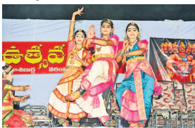
బిన్నవడేపల్లి చెరువు సమీపంలో సాంస్కృతిక కార్యక్రమాలు