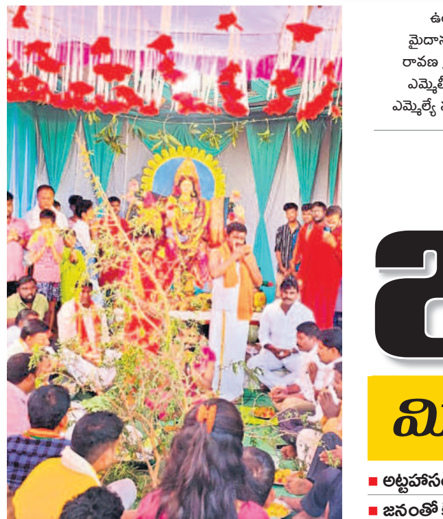
కాజీపేటలోని అలయంలో శమీ పూజ నిర్వహిస్తున్న అర్చకులు, పాల్గొన్న భక్తులు