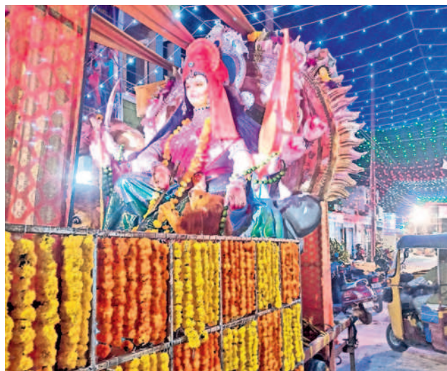
ఉర్దూ శివాంజనేయ ఆలయంలో ఏర్పాటు చేసిన దుర్గామాత శోభాయాత్ర