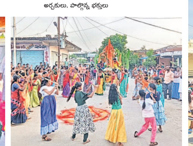
జయగిరిలో దుర్గామాత శోభాయాత్రలో కొలాటం ఆడుతున్న భక్తులు