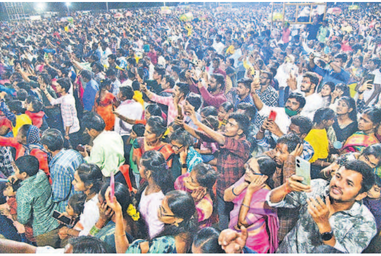
హనుమకొండ పద్మాక్షి గుట్ట వద్ద రామలీల కార్యక్రమానికి హాజరైన ప్రజలు