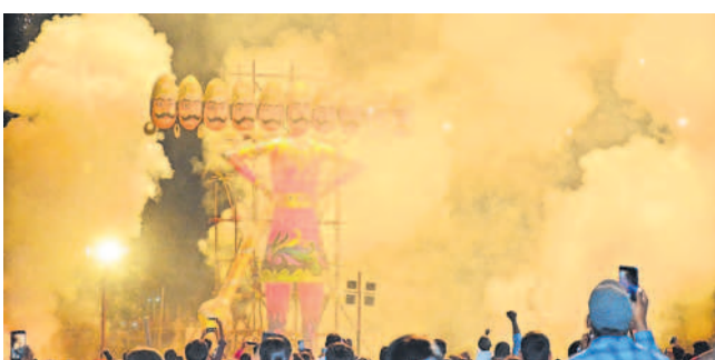
బిన్నవడ్డేపల్లి చెరువు సమీపంలో దహనమవుతున్న రావణుడి ప్రతిమ