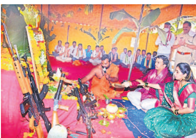
మానుకోట జిల్లా పోలీస్ కార్యాలయంలో ఆయుధ పూజ చేస్తున్న ఎస్సీ కుటుంబ సభ్యులు