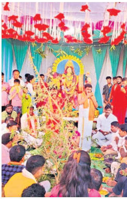
కాజీపేటలోని ఆలయంలో శమీ పూజ నిర్వహిస్తున్న అర్చకులు, పొల్లన్న భక్తులు