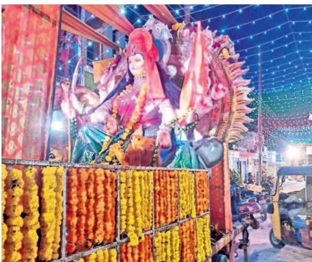
ఉర్షు శివాంజనేయ ఆలయంలో ఏర్పాటు చేసిన దుర్గామాత శోభాయాత్ర