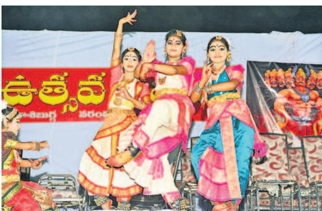
బిన్నవడ్డేపల్లి చెరువు సమీపంలో సాంస్కృతిక కార్యక్రమాలు