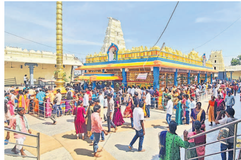
కురవి వీరభద్రుడి ఆలయంలో పాటితిన భక్తజనం