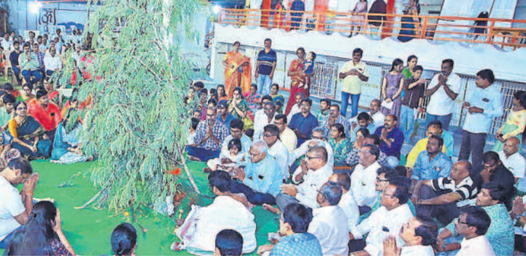
నల్లగొండ పట్టణంలోని శ్రీదేవి భూదేవి సమేత వేంకటేశ్వరస్వామి ఆలయంలో శమీ పూజలో పాల్గొన్న భక్తులు