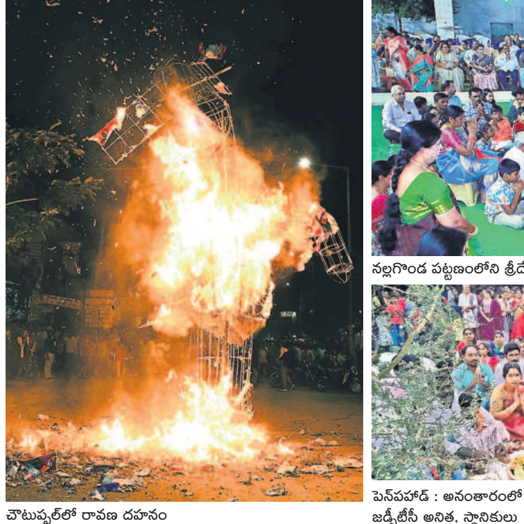
చౌటుప్పల్లో రావణ దహనం