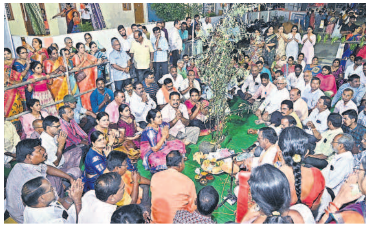
నల్లగొండ రామాలయంలో శమీ పూజ..