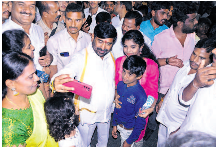
సూర్యాపేటలో దసరా వేడుకల్లో పాల్గొని చిన్నారులతో సెల్ఫీ దిగుతున్న మంత్రి గుంటకండ్ల జగదీశ్ రెడ్డి