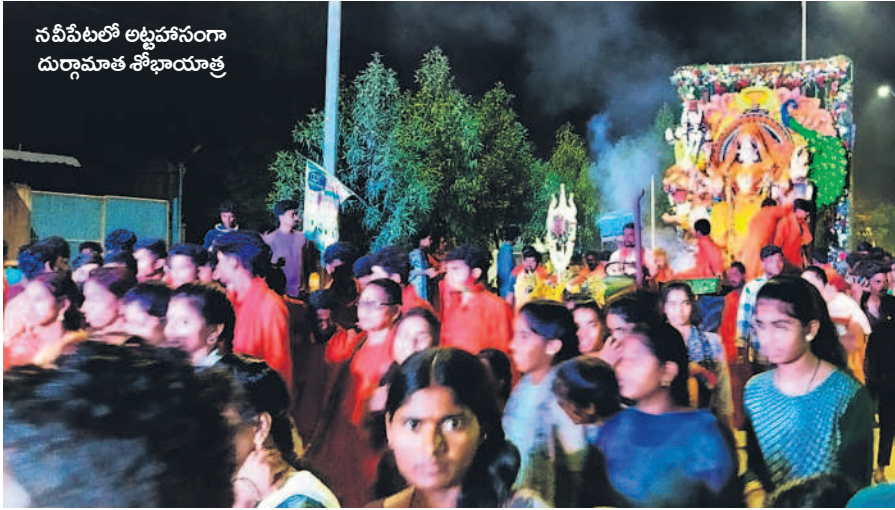
నవీపేటలో అట్టహాసంగా దుర్గామాత శోభాయాత్ర