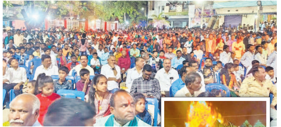
భీమగల్లో దసరా వేడుకలను తిలకిస్తున్న ప్రజలు