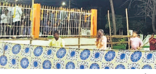
భీమగల్ పట్టణంలో రావణ దిష్టిబొమ్మ వధ

వైభవంగా శమి పూజలు • జనం మధ్య పండుగ జరుపుకొన్న ప్రజాప్రతినిధులు, నేతలు దసరా పండుగను ఉమ్మడి జిల్లా ప్రజలు ఘనంగా జరుపుకున్నారు. సోమవారం విజయదశమిని పురస్కరించుకొని ఆలయాల్లో ప్రత్యేక పూజలు చేశారు. జమ్మి చెట్టుకు పూజలు నిర్వహించి ఒకరికొకరు ఇచ్చిపుచ్చుకుంటూ పండుగ శుభాకాంక్షలు తెలుపుకున్నారు. పలు పట్టణాలు, గ్రామాల్లో రావణ దిష్టిబొమ్మల వధ నిర్వహించారు. ఈ కార్యక్రమాల్లో ఉమ్మడి జిల్లాకు చెందిన ప్రజాప్రతినిధులు, నాయకులు పాల్గొన్నారు.