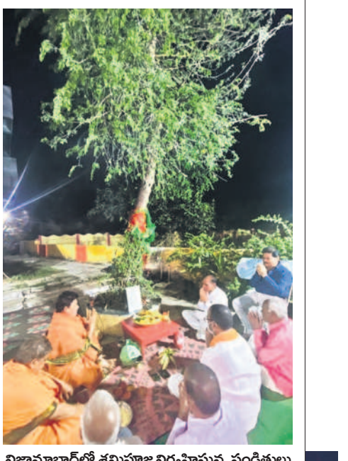
నిజామాబాద్లో శమి పూజలు నిర్వహిస్తున్న పండుగ