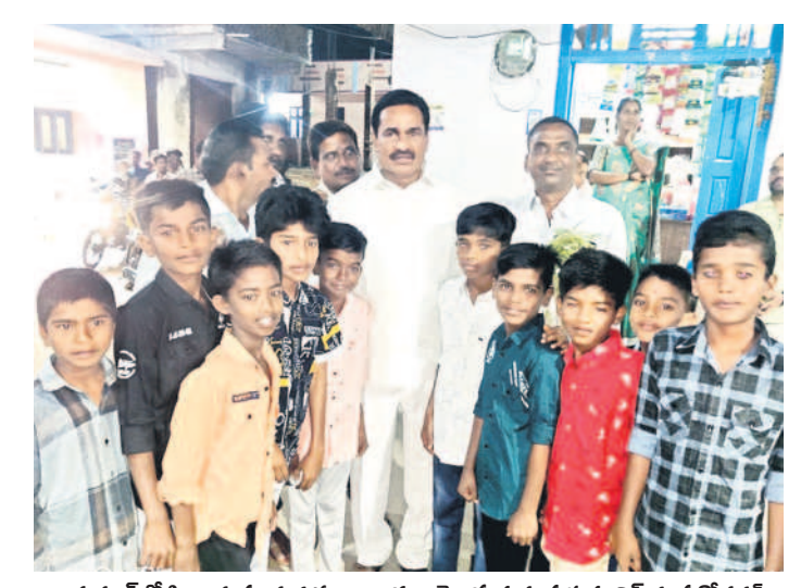
భక్తనూర్లో పిల్లలకు పండుగ శుభాకాంక్షలు తెలుపుతున్న ప్రభుత్వ వివే గంప గోవర్ధన్