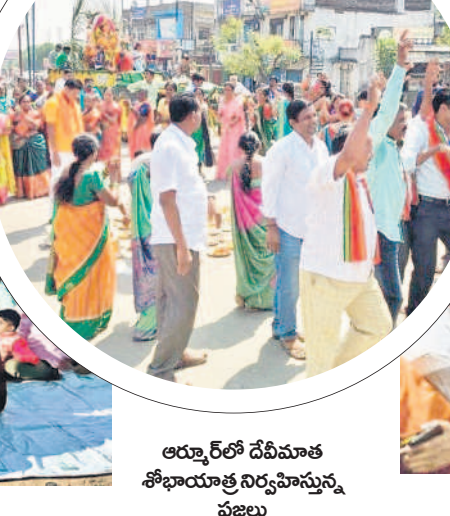
అర్నూర్లో దేవీమాత శోభాయాత్ర నిర్వహిస్తున్న ప్రజలు

వైభవంగా శమి పూజలు • జనం మధ్య పండుగ జరుపుకొన్న ప్రజాప్రతినిధులు, నేతలు దసరా పండుగను ఉమ్మడి జిల్లా ప్రజలు ఘనంగా జరుపుకున్నారు. సోమవారం విజయదశమిని పురస్కరించుకొని ఆలయాల్లో ప్రత్యేక పూజలు చేశారు. జమ్మి చెట్టుకు పూజలు నిర్వహించి ఒకరికొకరు ఇచ్చిపుచ్చుకుంటూ పండుగ శుభాకాంక్షలు తెలుపుకున్నారు. పలు పట్టణాలు, గ్రామాల్లో రావణ దిష్టిబొమ్మల వధ నిర్వహించారు. ఈ కార్యక్రమాల్లో ఉమ్మడి జిల్లాకు చెందిన ప్రజాప్రతినిధులు, నాయకులు పాల్గొన్నారు.