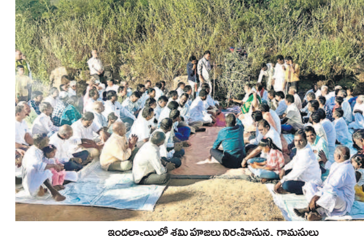
ఇందల్వాయిలో శమి పూజలు నిర్వహిస్తున్న గ్రామస్థులు