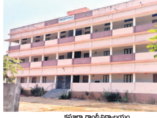
కస్తూర్బా గాంధీ విద్యాలయం

విద్యారంగానికి పెద్దపీట.. మండల కేంద్రానికి మంజూరైన కస్తూర్బా గాంధీ బాలికల విద్యాలయానికి రూ.కోటి 50 లక్షలతో భవనాలు నిర్మించారు. 10వ తరగతి పూర్తికాగానే విద్యార్థులకు నేరుగా ఆడిషన్లు కల్పించి ఉన్నత విద్యను అందిస్తున్నారు. గ్రామంలో శిథిలావస్థకు చేరుకున్న పాఠశాలను తొలగించి దానిస్థానంలో రూ.4కోట్ల 50 లక్షలు విద్యాశాఖ మంజూరు చేయడంతో కార్పొరేట్ తరహాలో ఉన్నత, ప్రాథమిక పాఠశాల భవనాల నిర్మాణ పనులు శరవేగంగా కొనసాగుతున్నాయి. పోటీ పరీక్షలకు సన్నద్ధమయ్యే అభ్యర్థుల కోసం రూ.17.50 లక్షలతో నూతన గ్రంథాలయాన్ని నిర్మించారు.