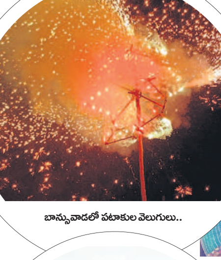
బాన్సువాడలో వజ్రకుల వెలుగులు..