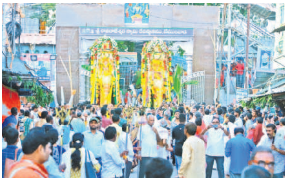
వేములవాడ టౌన్: ఆలయం ఎదుట పెద్దసేవపై ఊరేగుతున్న ఉత్సవమూర్తులు