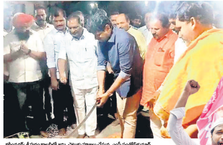
కరీంనగర్: శ్రీపురం కాలనీలో జమ్మి చెట్టుకు పూజలు చేస్తున్న ఎంపీ సంతోష్ కుమార్, మంత్రి కొమ్మల ఈశ్వర్, సివిల్ సప్లయర్ కార్పొరేషన్ చైర్మన్ రబీందర్ సింగ్