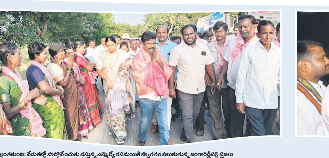
ఇగంతకుంట: వేడుకల్లో పాల్గొనేందుకు వస్తున్న ఎమ్మెల్యే రసముని స్వాగతం వలకుతున్న జంగారెడ్డిపల్లి ప్రజలు