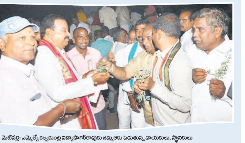
మెట్లపల్లి: ఎమ్మెల్యే కల్వకుంట్ల విద్యాసాగర్ రావుకు జమ్మి చెట్టుకు నూరుకులు, స్థానికులు