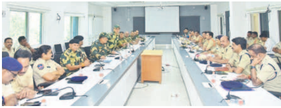
మాట్లాడుతున్న సీపీ సుబ్బారాయుడు