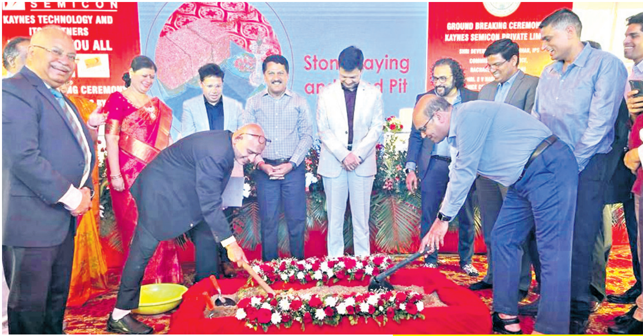
కేన్స్ సెమికాన్ పరిశ్రమ నిర్మాణానికి భూమిపూజ చేస్తున్న ప్రతినిధులు

రంగారెడ్డి జిల్లాకు మరో ఎలక్ట్రానిక్ పరిశ్రమ ఫ్యాక్ట్ కాన్ తరహాలో కొంగరకలాన్ లో కేన్స్ సెమికాన్