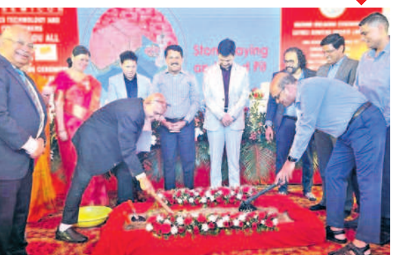
కేన్స్ సెమికాన్ పరిశ్రమ నిర్మాణానికి భూమిపూజ చేస్తున్న ప్రతినీధులు