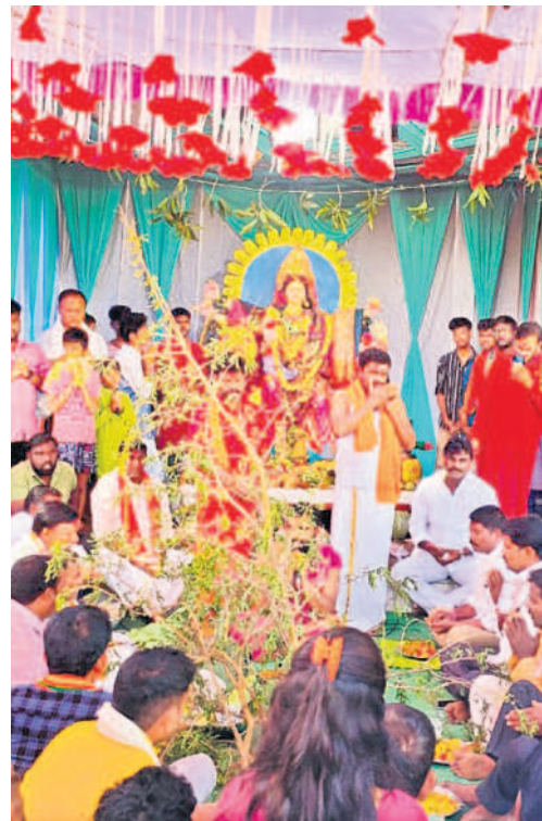
కాజీపేటలోని అలయంలో శమీ పూజ నిర్వహిస్తున్న అర్చకులు, పాల్గొన్న భక్తులు