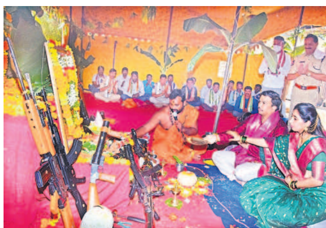
మానుకోట జిల్లా పోలీస్ కార్యాలయంలో ఆయుధ పూజ చేస్తున్న ఎస్సీ కుటుంబ సభ్యులు