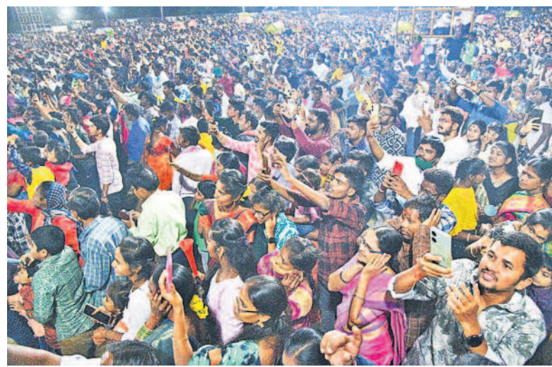
హనుమకొండ పద్మాక్షి గుట్ట వద్ద రామలీల కార్యక్రమానికి హాజరైన ప్రజలు