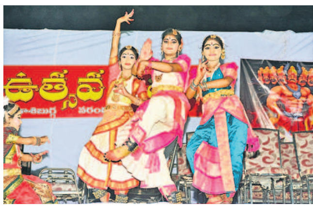
బిన్నవడేపల్లి చెరువు సమీపంలో సాంస్కృతిక కార్యక్రమాలు