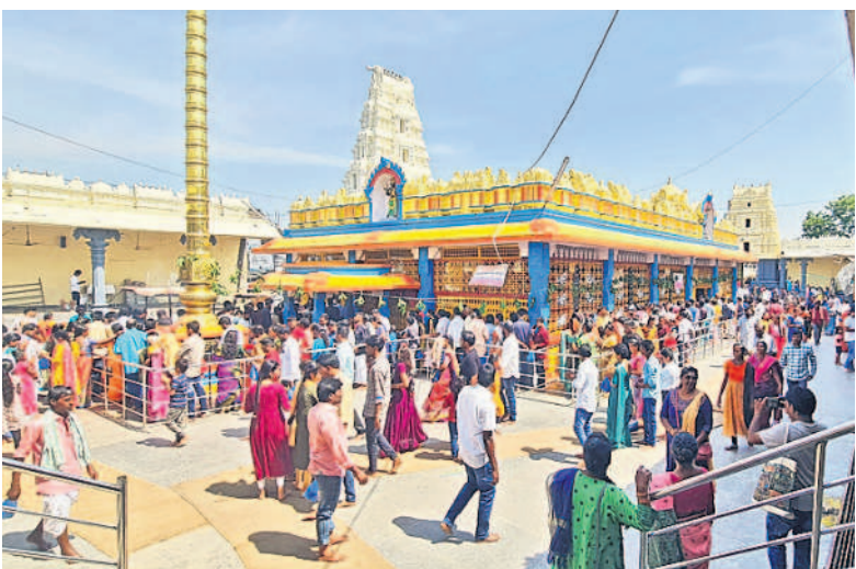
కురవి వీరభద్రుడి ఆలయంలో పాటిత్తిన భక్తజనం