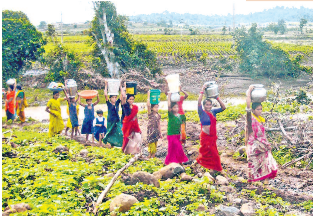
'బిడ్డా... మన వాకిట్లో మందిసిట్టు దొరికినట్టు కలవింది... అన్నది మల్లప్ప. 'అయ్యటి కలలు కనరాద అన్న... నడుమ ముందు' అంటూ ఒకవేళిలో లిండే మరో వేళిలో బకెట్ పట్టుకుని పరుగుదీరినది గం గం. అప్పుడు ఉమ్మడి రాష్ట్రంలో తెలంగాణ వల్లపడుచు కల ఇది. గొంతు తడవరాకే పట్టణం కాదు, ఏదెనిమిదెళ్ళ బిడ్డలా నీళ్ళ కోసం కిటిమీటల్ల నడవాలన్న పరిస్థితి. అప్పుటి మోయలేని బరువును నూరిస్తుంది... నిజామాబాద్ జిల్లా వర్షి మండలం కోకేలా వద్ద ఉండే చిక్కెటి.