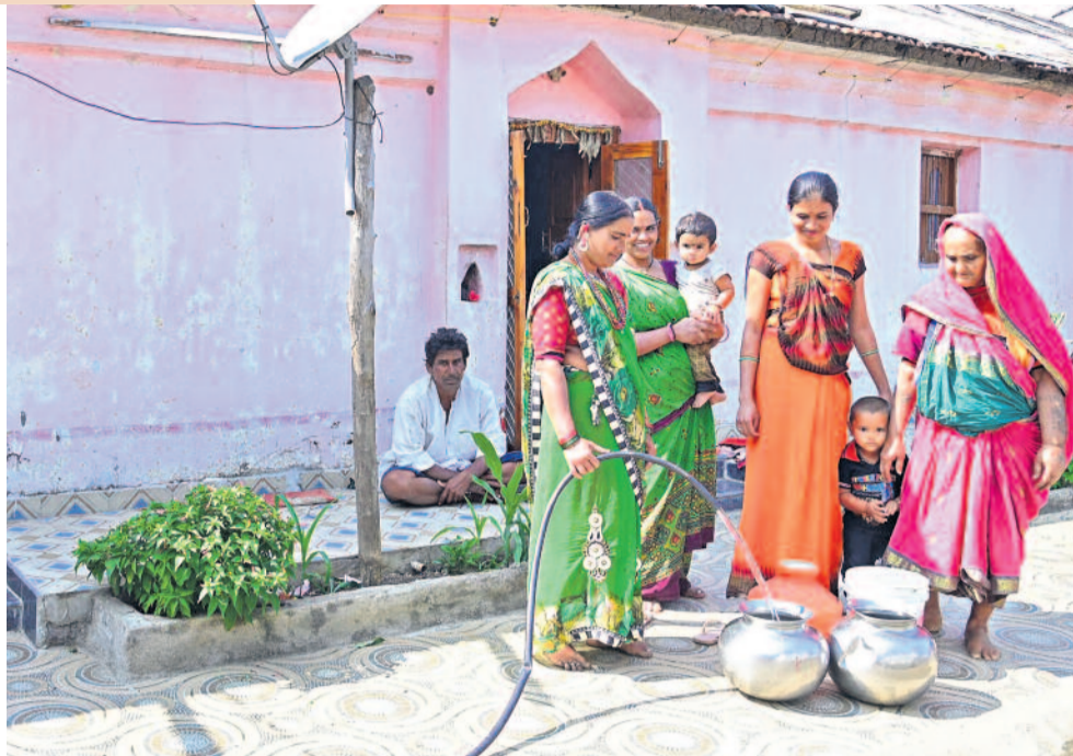
మరో పక్క... అప్పుడు మల్లప్పలాంటి కల కలలు నాయకుడు కేసీఆర్ కన్నా. ఒక్క గ్రామానికే కాదు... తెలంగాణ వల్లపడుచు ఇంటి ముందు మందిసిట్టే నవ్వడి వినిపించాలని ఆశపడతారు. గ్రామాలు, పట్టణాలే కాదు, లండన్ తండాలూ, అదివాసీ గూడెల్లోనూ ఏ అడవికన్నా తల మీద బిందె ఎత్తాలన్న పరిస్థితి లేకుండా చేశారు. మిష్నర్ భగీరథతో స్వప్నమైన నీటిని వాకిట్లోకి తీసుకువచ్చారు. ఇప్పుడు అదే కోకేలా వద్దనే లండన్ లాంటి పట్టణాలు నల్లబెట్లతో బిందెల్లో నీళ్ళ సంతోషంగా నింపుకొంటున్నాయి.