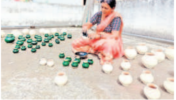
రంగులు దిద్దుతున్న కళాకారిణి

పదిరోజుల ముందునుంచే విక్రయాలు.. లక్ష్మీ పూజలకు దొంతులను పెడతారు. కళాకారులు దొంతులను తయారు చేసి వాటికి రంగులు దిద్దే పనుల్లో నిమగ్నమైనారు. దొంతులు ఆకట్టుకునే విధంగా రంగులను మహిళా కళాకారులు అద్దుతున్నారు. పండుగకు 10 రోజుల ముందు నుంచే వీటి విక్రయాలను చేపట్టేందుకు వీలుగా తయారు చేసి సిద్ధంగా ఉంచేందుకు ఏర్పాట్లు చేస్తున్నారు.