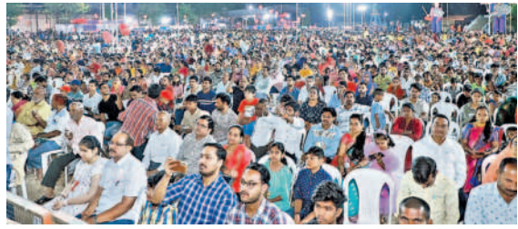
కార్యక్రమంలో పాల్గొన్న ప్రజలు