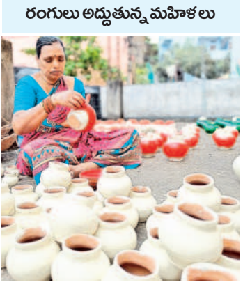
దొంతులకు రంగులు దిద్దుతున్న మహిళ

అబ్దిడ్న్, అక్టోబర్ 25 : దీపావళి సందర్భంగా ఇంటింటా ప్రమిదలు వెలిగిస్తారు. నివాసాల్లో దొంతులను ఏర్పాటు చేసి లక్ష్మీ పూజలు నిర్వహిస్తారు. ఈ నేపథ్యంలో నగరంలోని పలు ప్రాంతాల్లో ప్రమిదలు, దొంతుల తయారీ ఊపందుకున్నది. ఆసిఫ్ నగర్ లో కళాకారులు తయారు చేయడంతో పాటు వాటిని చూపరులు ఆకట్టుకునే విధంగా రంగులను అద్దుతున్నారు. ఆసిఫ్ నగర్, మహాలక్ష్మీ నగర్ కుమార్ వాడి ప్రాంతాల్లో వీటి తయారీ జోరుగా సాగుతోంది. గోషామహల్ నియోజకవర్గం పరిధిలోని ఆసిఫ్ నగర్, మహాలక్ష్మీ నగర్ కుమార్ వాడిలో ఈ తయారీ జరుగుతోంది.