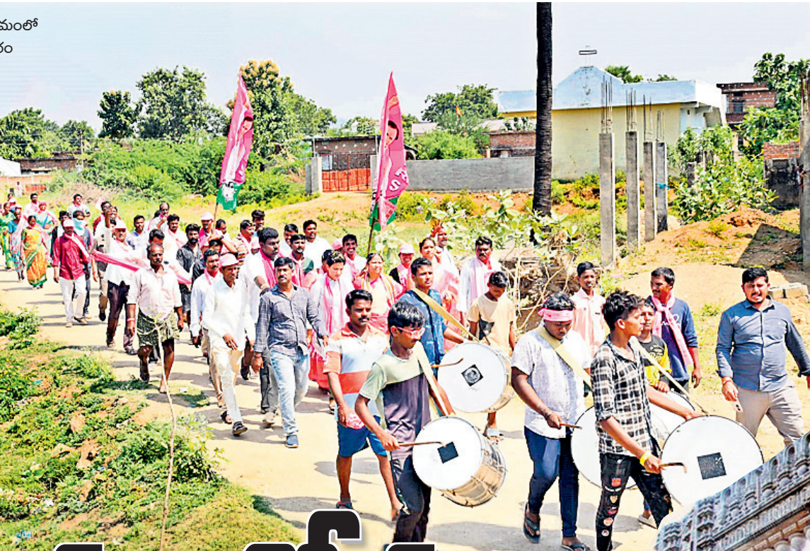
బయ్యారం కొత్తపేట గ్రామంలో బీఆర్ఎస్ శ్రేణుల ప్రచారం