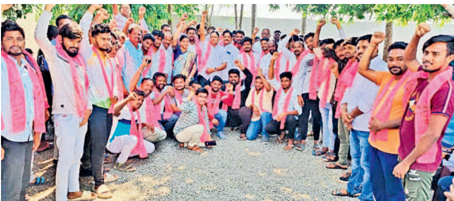
మరిపెడ : బీఆర్ఎస్లో చేరిన యువతతో డోర్లకర్ల ఎమ్మెల్యే అభ్యర్థి రెడ్డానాయక్