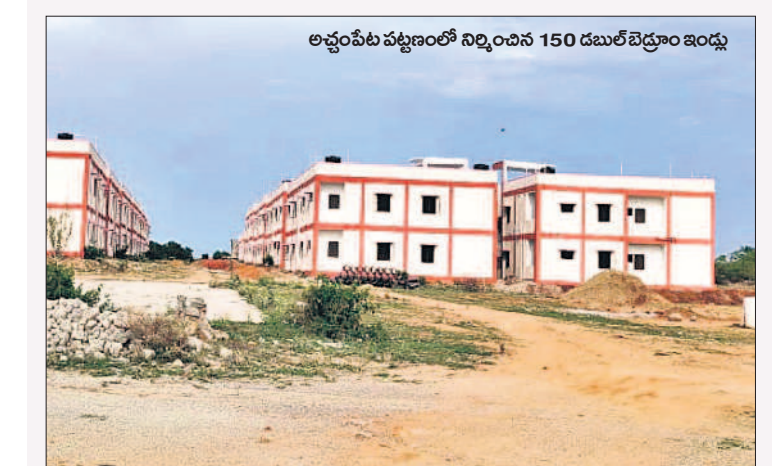
అచ్చంపేట పట్టణంలో నిర్మించిన 150 డబుల్ బెడ్రూం ఇంట్లు