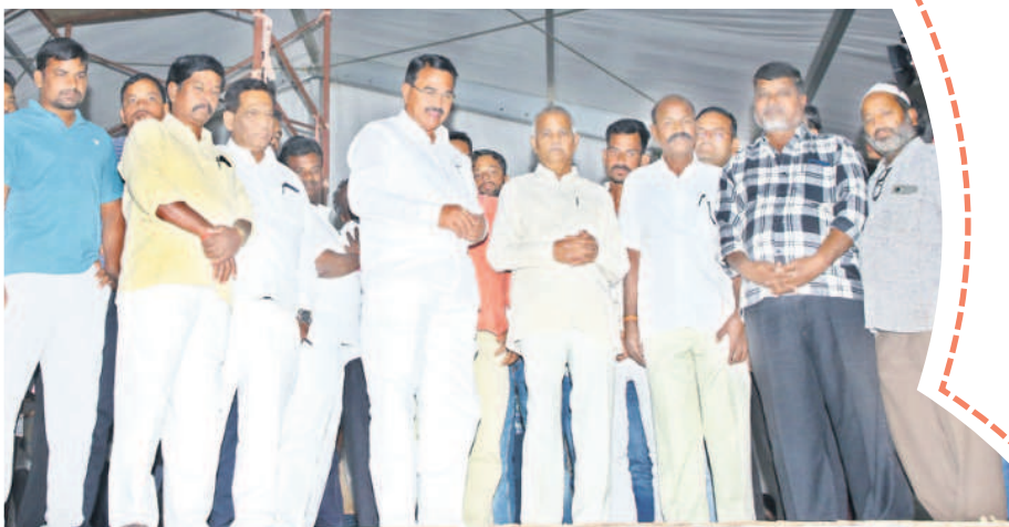
సభ ఏర్పాట్లను పరిశీలిస్తున్న వ్యవసాయ శాఖ మంత్రి సింగిరెడ్డి నిరంజన్ రెడ్డి, మాజీ ఎంపీ రావుల చంద్రశేఖరరెడ్డి