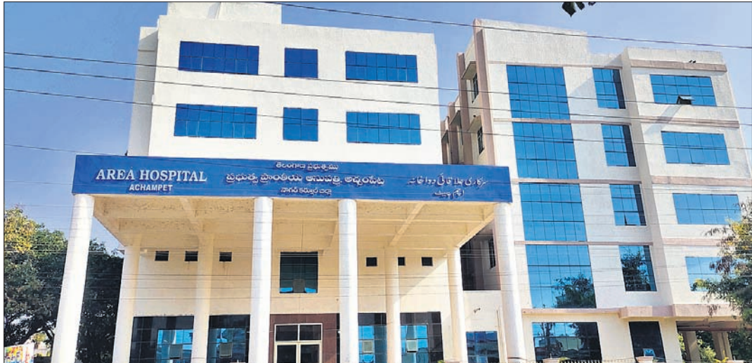
అచ్చంపేట పట్టణంలో నిర్మించిన ప్రాంతీయ ప్రభుత్వ దవాఖాన

అచ్చంపేట నియోజకవర్గంలోని అనేక గ్రామాలకు కృష్ణ జలాలు అందుతున్నాయి. ఇటీవల వర్షాలంలో రాష్ట్ర వ్యాప్తంగా వర్షాలు కురిసిన ఈ ప్రాంతంలో తక్కువ వర్షపాతం నమోదైంది. దీంతో ఈ ప్రాంతంలోని చెరువుల్లోకి తగినంత నీరు చేరలేదు. ఎంజీకేఆర్ వివేకాచార్యులతో గౌలును కట్టు చెరువులు పూర్వస్థాపనం సంతరించుకోగా ఒకప్పుడు పలువెలబోయిన ఆయన కట్టు భూమిలు ఇప్పుడు ఆకుపచ్చగా మారాయి. పచ్చగా కళకళాడుతున్నాయి. తెలంగాణ సర్కారు వ్యవసాయానికి 24 గంటల కరెంటు ఇస్తుండడంతోపాటు ఎంజీకేఆర్ రాకతో చెరువులు, కుంటలు నిండి భూగర్భజలాలు పెరిగి భూమి కింద పంటలు విస్తీర్ణం మరింత పెరిగింది. నీళ్లు పుష్కలంగా ఉండడంతో రైతులు వ్యవసాయానికి అనుబంధంగా పండ్ల తోటలు, కూరగాయల సాగులో దృష్టి పెట్టి రాజీవున్నారు.