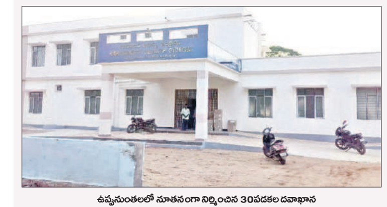
ఉమ్మడి జిల్లాలో నూతనంగా నిర్మించిన 30 పడకల దవాఖాన

పరుగులు పెడుతున్న అభివృద్ధి వలసలు, వెనుకబాటుకు గురైన అచ్చంపేట ప్రాంతం తెలంగాణ ప్రభుత్వంలో అభివృద్ధిలో పరుగులు పెడుతున్నది. ప్రభుత్వ విపీ, ఎమ్మెల్యే