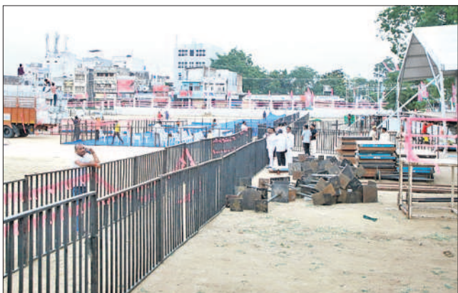
వనపర్తిలో ముస్తాబవుతున్న ప్రజా ఆశీర్వాద సభా వేదిక