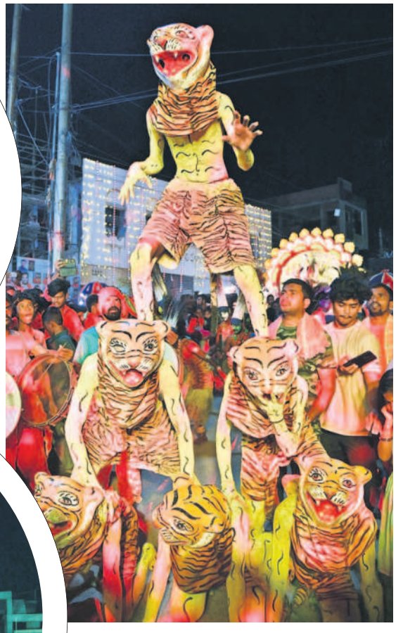
కోటగల్లిలో పులి వేషధారణలో కళాకారుల విన్యాసం