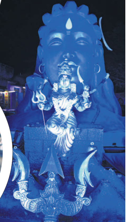
భక్తులను ఆకట్టుకునేలా ఏర్పాటు చేసిన సిట్టింగ్..