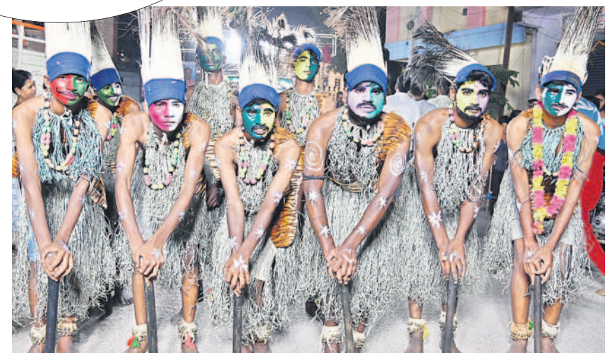
గిరిజన వేషధారణలో కళాకారులు