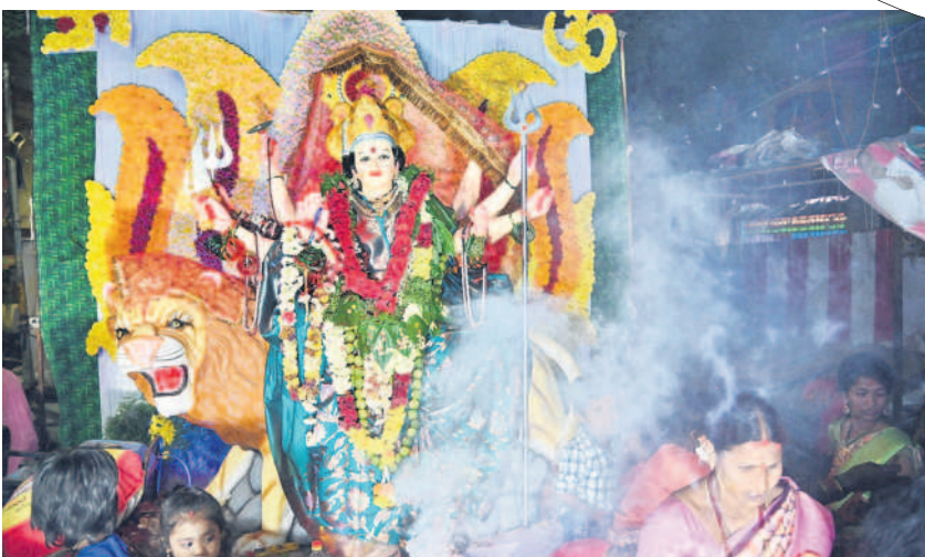
దుర్గామాతకు పూజలు చేస్తున్న భక్తులు