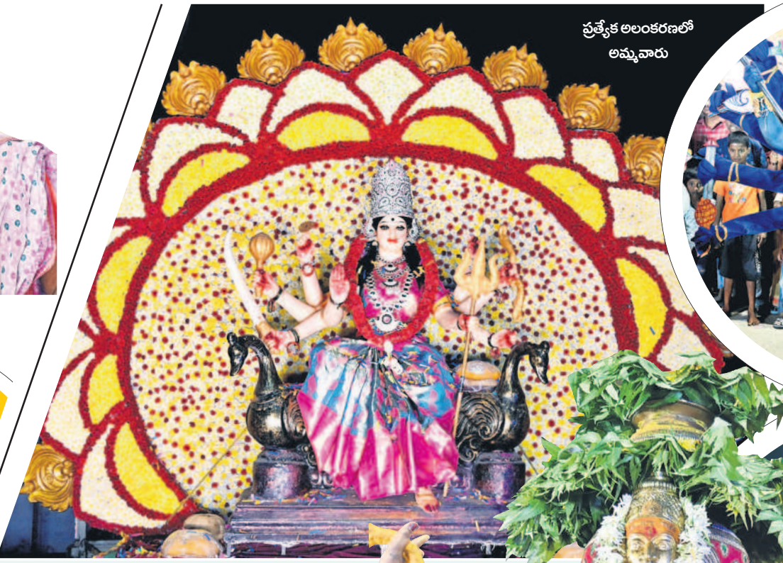
ప్రత్యేక అలంకరణలో అమ్మవారు