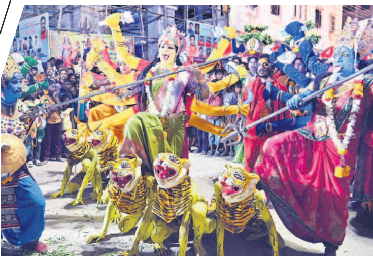
దేవీమాత వేషధారణలో కళాకారులు