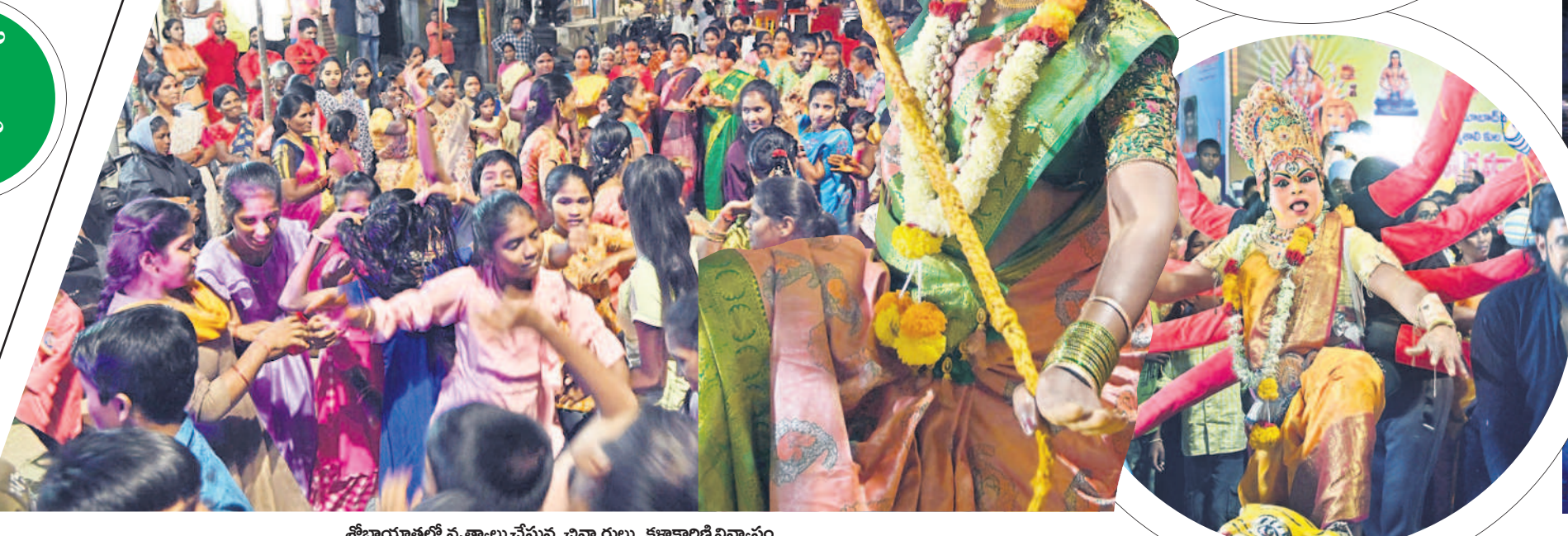
శోభాయాత్రలో నృత్యాల చేస్తున్న చిన్నారులు, కళాకారిణి విన్యాసం

నిజామాబాద్ కల్లూర్, అక్టోబర్ 25: శరన్నవరాత్రులను పురస్కరించుకొని నిజామాబాద్ జిల్లాలో ఈ నెల 15న కొలువుదీరిన దుర్గామాత ప్రతిమలను బుద్ధవారం నిమజ్జనం చేశారు. విశేష పూజలందుకున్న అమ్మవారిని ప్రత్యేక వాహనాల్లో అలంకరించి డీజే చప్పుట్ల, బ్యాండు మేకలతో శోభాయాత్ర నిర్వహించారు. కోటగల్లి మార్కండేయ మందిరం నుంచి ప్రారంభమైన శోభాయాత్ర, గాయత్రీనగర్, వల్లి చౌరస్తా, ఖిల్లా, అర్కవల్లి, జాన్సంపేట మీదుగా బాసర గోదావరి వరకు నిర్వహించారు. ఆనంతరం గోదావరి వద్ద ప్రత్యేక పూజలు నిర్వహించి దుర్గామాత ప్రతిమలను నిమజ్జనం చేశారు.