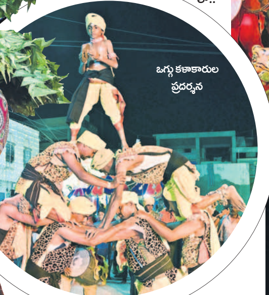
ఒగ్గు కళాకారుల ప్రదర్శన