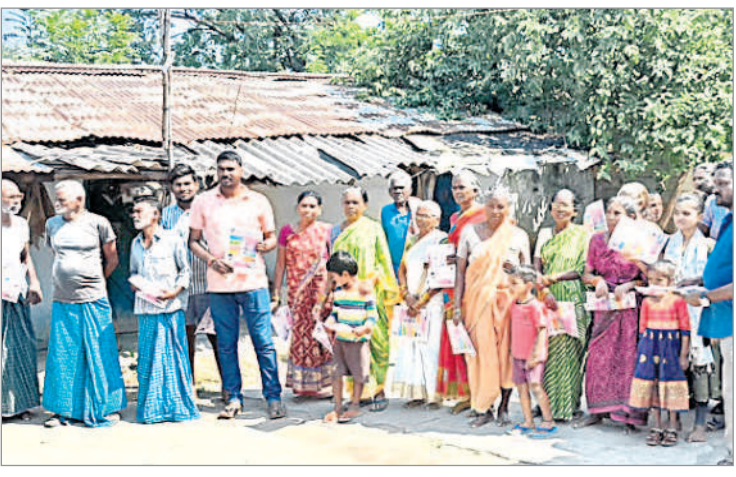
ప్రభుత్వ పథకాలపై కళాకారుల ఆటపాటలను తిలకిస్తున్న ప్రజలు

మందమల, అక్టోబర్ 25 : ఎన్నికల నేపథ్యంలో మందమల మున్సిపాలిటీలో బీఆర్ఎస్ కళాకారుల కళాకారులు తమ గేయాల ద్వారా ప్రచారం చేస్తున్నారు. ప్రత్యేకంగా రూపొందించిన వాహనంలో ఆయా వార్డుల్లో తిరుగుతూ జనకూడలి ప్రదేశాల్లో తెలంగాణ ప్రభుత్వం అమలు చేస్తున్న అభివృద్ధి, సంక్షేమ పథకాలు, మ్యూనిసిపల్ స్టాలోని హామీలను తమ గేయాల ద్వారా ప్రజలకు వివరిస్తున్నారు. మున్సిపాలిటీ పరిధిలోని ఫిల్టర్ బెడ్ ఏరియా, ప్రాణహిత కాలనీల్లో బుధ