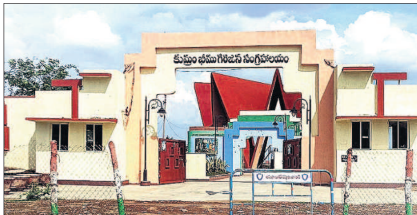
జోడేపూట్లో జల్, జంగల్, జమీన్ ఆర్జితో నిర్మించిన ముఖద్వారం