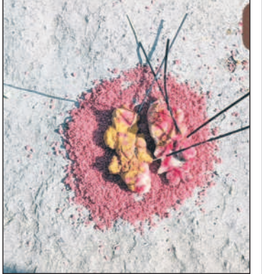
రంగు బియ్యం, నిమ్మకాయలు ఇతర సామగ్రితో క్షుద్రపూజలు నిర్వహించిన దృశ్యం

పినట్లు తెలిపారు. దీంతో ఇంట్లోని వారందరికీ ఆరోగ్యాలు బాగోలేక తన భర్త మృతి చెందినట్లు ఆవేదన వ్యక్తం చేశారు. ఇలాంటి ఘటనలు భయభ్రాంతులకు గురిచేయడమే కాకుండా మూడో నమ్మకాల వైపు మళ్ళలా చోటు చేసుకుంటున్నాయని, ఇలాంటి ఘటనలు పునరావృతం కాకుండా సంబంధిత అధికారులు చర్యలు చేపట్టాలని పలువురు కోరుతున్నారు. ఈ విషయంపై గ్రామ పెద్దలతో పాటు పోలీసులకు సమాచారం అందించినట్లు వారు తెలిపారు.