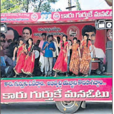
మందమలలో ప్రచారం చేస్తున్న కళాకారులు

మందమల, అక్టోబర్ 25 : ఎన్నికల నేపథ్యంలో మందమల మున్సిపాలిటీలో బీఆర్ఎస్ కళాకారుల కళాకారులు తమ గేయాల ద్వారా ప్రచారం చేస్తున్నారు. ప్రత్యేకంగా రూపొందించిన వాహనంలో ఆయా వార్డుల్లో తిరుగుతూ జనకూడలి ప్రదేశాల్లో తెలంగాణ ప్రభుత్వం అమలు చేస్తున్న అభివృద్ధి, సంక్షేమ పథకాలు, మ్యూనిసిపల్ స్టాలోని హామీలను తమ గేయాల ద్వారా ప్రజలకు వివరిస్తున్నారు. మున్సిపాలిటీ పరిధిలోని ఫిల్టర్ బెడ్ ఏరియా, ప్రాణహిత కాలనీల్లో బుధ