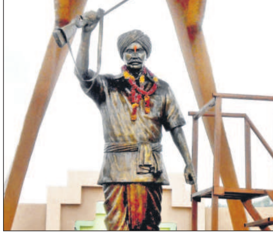
బీఆర్ఎస్ ప్రభుత్వం ఏర్పాటు చేసిన నిలువెత్తు కాంస్య విగ్రహం