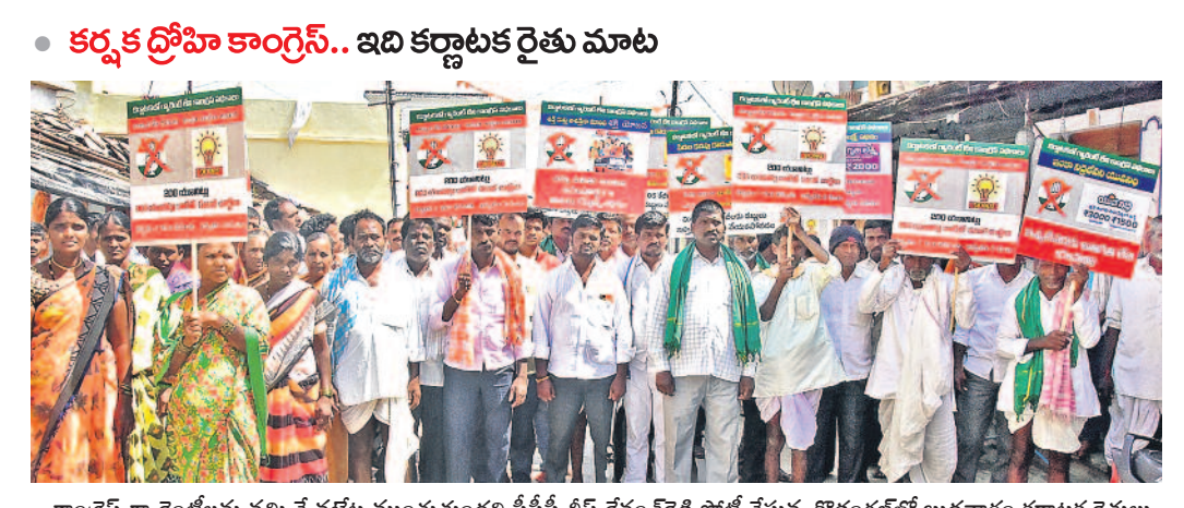
కాంగ్రెస్ గ్యారంటీలను నమ్మే నష్టం ముందుకు వచ్చిన పీసీసీ చీఫ్ రేవంత్ రెడ్డి పోటీ చేస్తున్న కొడంగల్లో బుధవారం కర్ణాటక రైతులు ర్యాలీ చేపట్టారు. ఆ పార్టీ మాటలు నమ్మి తాము మోసపోయామని, ఆ దుస్థితి తెలంగాణ ప్రజలకు రావొద్దని తెలిపారు.