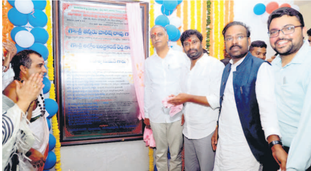
చెన్నూర్ పట్టణంలో నిర్మించిన 50 పడుకల దవాఖాన ప్రారంభిస్తున్న మంత్రి హరీష్ రావు, విపి బాల్క సుమన్, ఎంపీ వెంకటేశ్ నేతకాని, మంచెర్యాల కలెక్టర్ బదావత్ సంతోష్ (ఫైల్)