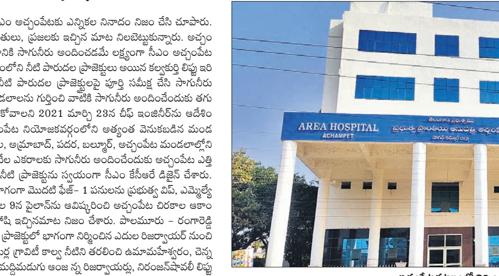
అచ్చంపేట పట్టణంలో నిర్మించిన ప్రాంతీయ ప్రభుత్వ దవాఖానం

అచ్చంపేట నియోజకవర్గంలోని అనేక గ్రామాలకు కృష్ణ జలాలు అందుతున్నాయి. ఇటీవల వర్షాలంలో రాష్ట్ర వ్యాప్తంగా వర్షాలు కురిసిన ఈ ప్రాంతంలో తక్కువ వర్షపాతం నమోదైంది. దీంతో ఈ ప్రాంతంలోని చెరువుల్లోకి తగినంత నీరు చేరలేదు. ఎంజీవీఆర్ఓ మహాత్మ్యంతో గౌలును కట్టు చెరువులు పూర్వస్థితిలో సంతరించుకోగా ఒకప్పుడు బలవెలబోయిన ఆయన కట్టు మామూలు ఇప్పుడు ఆకుపచ్చగా మారాయి. పచ్చగా కళకళలాడుతున్నాయి. తెలంగాణ సర్కారు వ్యవసాయానికి 24 గంటల కరింలు ఇస్తుండడంతోపాటు ఎంజీవీఆర్ఓ రాకతో చెరువులు, కుంటలు నిండి భూగర్భజలాలు పెరిగి భూపల్లె కింద పంటలు విస్తీర్ణం మరింత పెరిగింది. నీళ్లు పుష్కలంగా ఉండడంతో రైతులు వ్యవసాయానికి అనుబంధంగా పండ్ల తోటలు, కూరగాయల సాగునీరు నిర్మించుకోవడం ప్రారంభించారు. అచ్చంపేట పెరుగులు ఇప్పుడు ఆకుపచ్చగా మారాయి. పచ్చగా కళకళలాడుతున్నాయి. తెలంగాణ సర్కారు వ్యవసాయానికి 24 గంటల కరింలు ఇస్తుండడంతోపాటు ఎంజీవీఆర్ఓ రాకతో చెరువులు, కుంటలు నిండి భూగర్భజలాలు పెరిగి భూపల్లె కింద పంటలు విస్తీర్ణం మరింత పెరిగింది. నీళ్లు పుష్కలంగా ఉండడంతో రైతులు వ్యవసాయానికి అనుబంధంగా పండ్ల తోటలు, కూరగాయల సాగునీరు నిర్మించుకోవడం ప్రారంభించారు. అచ్చంపేట పెరుగులు ఇప్పుడు ఆకుపచ్చగా మారాయి. పచ్చగా కళకళలాడుతున్నాయి. తెలంగాణ సర్కారు వ్యవసాయానికి 24 గంటల కరింలు ఇస్తుండడంతోపాటు ఎంజీవీఆర్ఓ రాకతో చెరువులు, కుంటలు నిండి భూగర్భజలాలు పెరిగి భూపల్లె కింద పంటలు విస్తీర్ణం మరింత పెరిగింది. నీళ్లు పుష్కలంగా ఉండడంతో రైతులు వ్యవసాయానికి అనుబంధంగా పండ్ల తోటలు, కూరగాయల సాగునీరు నిర్మించుకోవడం ప్రారంభించారు.