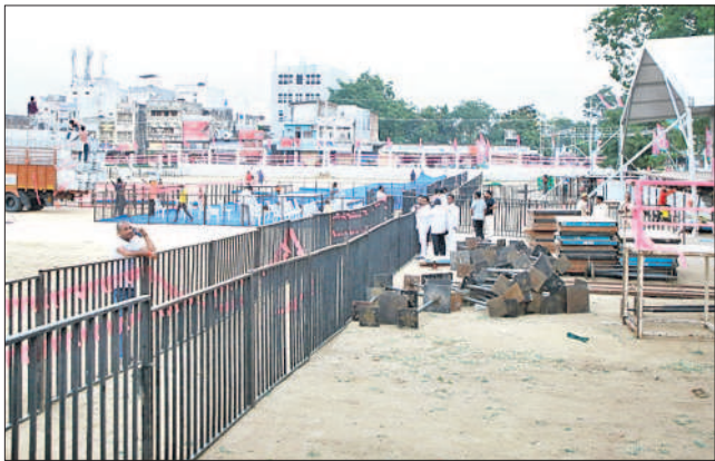
వనపర్తిలో ముస్తాబవుతున్న ప్రజా ఆశీర్వాద సభా వేదిక