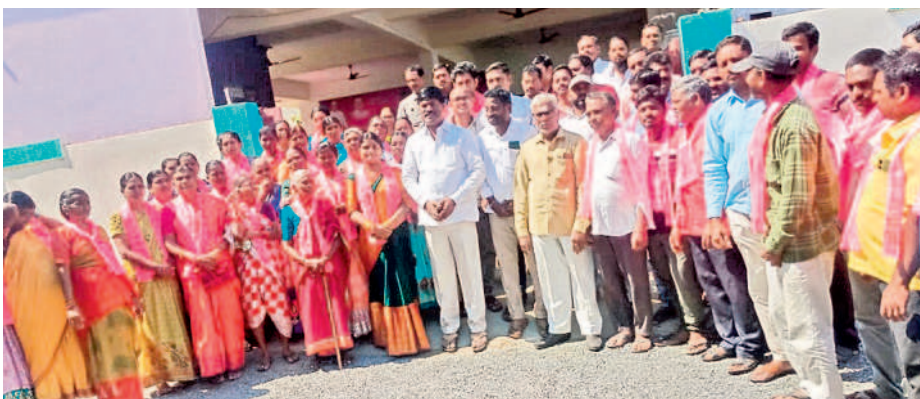
నర్సంపేట : బీఆర్ఎస్లో చేరిన పట్టణంలోని ఒకటి వార్డు కాంగ్రెస్ కార్యకర్తలకో నర్సంపేట ఎమ్మెల్యే అభ్యర్థి పెద్ది సుదర్శన్రెడ్డి