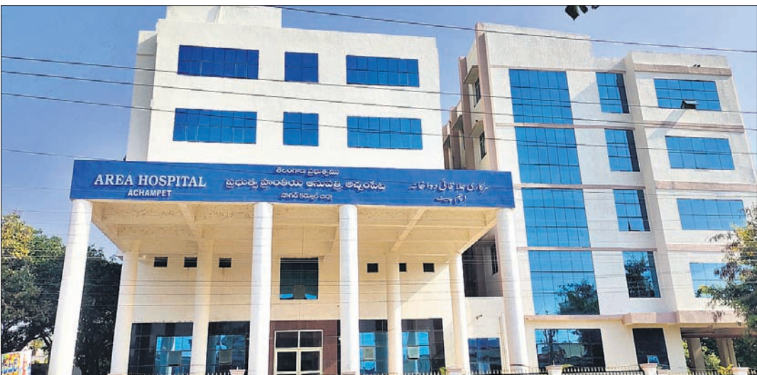
అచ్చంపేట పట్టణంలో నిర్మించిన ప్రాంతీయ ప్రభుత్వ దవాఖానం

అచ్చంపేట నియోజకవర్గంలోని అనేక గ్రామాలకు కృష్ణ జలాలు అందుతున్నాయి. ఇటీవల వర్షాలంలో రాష్ట్ర వ్యాప్తంగా వర్షాలు కురిసిన ఈ ప్రాంతంలో తక్కువ వర్షపాతం నమోదైంది. దీంతో ఈ ప్రాంతాల్లోని చెరువుల్లోకి తగినంత నీరు చేరలేదు. ఎంజీవీఆర్ఎం మహాత్మ్యంతో గౌలును కట్టు చెరువులు పూర్వస్థితిలోనూ ఉంటున్నాయి. పట్టణంలో 150 యాన ఆయకట్టు భూమిలు ఇప్పుడు ఆకుపచ్చగా మారాయి. పచ్చగా కళకళాడుతున్నాయి. తెలంగాణ సర్కారు వ్యవసాయానికి 24 గంటల కరెంటు ఇస్తుండడంతోపాటు ఎంజీవీఆర్ఎం రాకతో చెరువులు, కుంటలు నిండి భూగర్భజలాలు పెరిగి భూమి కింద పంటలు విస్తీర్ణం మరింత పెరిగింది. నీళ్లు పుష్కలంగా ఉండడంతో రైతులు వ్యవసాయానికి అనుబంధంగా పండ్ల తోటలు, కూరగాయల సాగునీరు సాగునీరు పెట్టి రాజీవున్నారు.