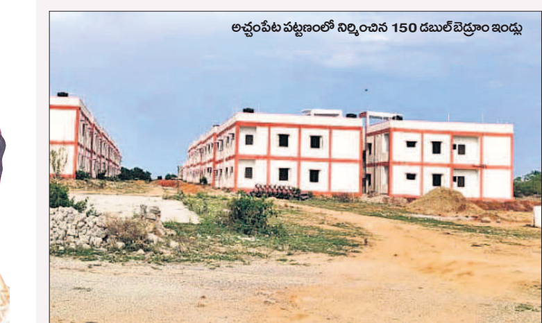
అచ్చంపేట పట్టణంలో నిర్మించిన 150 డబుల్ బెడ్రూం ఇండ్లు

వలసలు, వెనుకబాటుకు గురైన అచ్చంపేట ప్రాంతం తెలంగాణ ప్రభుత్వంలో అభివృద్ధిలో పరుగులు పెడుతున్నది. ప్రభుత్వ విపీ, ఎమ్మెల్యే