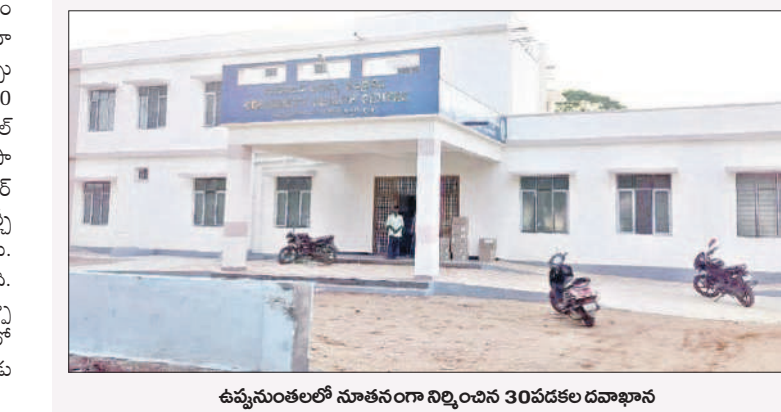
ఉమ్మడి మండలంలో నూతనంగా నిర్మించిన 30 పడకల దవాఖానం