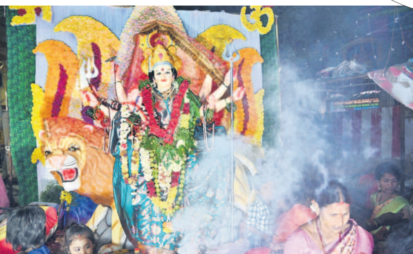
దుర్గామాతకు పూజలు చేస్తున్న భక్తులు