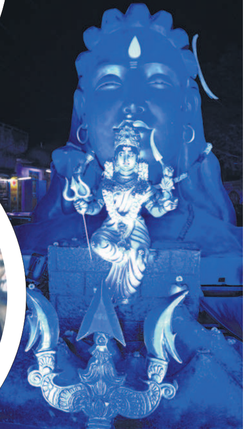
భక్తులను ఆకట్టుకునేలా ఏర్పాటు చేసిన సిట్టింగ్..