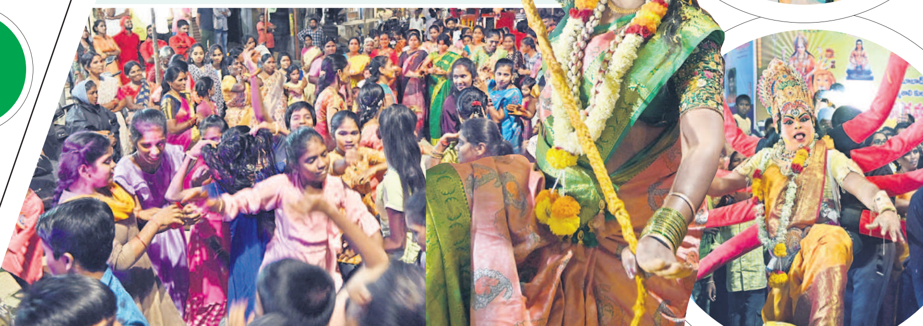
శోభాయాత్రలో నృత్యాల చేస్తున్న చిన్నారులు, కళాకారిణి విన్యాసం

నిజామాబాద్ కల్లూర్, అక్టోబర్ 25: శరన్నవరాత్రులను పురస్కరించుకొని నిజామాబాద్ జిల్లాలో ఈ నెల 15న కొలువుదీరిన దుర్గామాత ప్రతిమలను బుద్ధవారం నిమజ్జనం చేశారు. విశేష పూజలందుకున్న అమ్మవారిని ప్రత్యేక వాహనాల్లో అలంకరించి డీజే చప్పుళ్లు, బ్యాండు మేళాలతో శోభాయాత్ర నిర్వహించారు. కోటగల్లి మార్కెట్లోనుంచి ప్రారంభమైన శోభాయాత్ర, గాయత్రీనగర్, వల్లి చౌరస్తా, ఖిల్లా, అర్చనల్లి, జాన్సంపేట మీదుగా బాసర గోదావరి వరకు నిర్వహించారు. ఆనంతరం గోదావరి వద్ద ప్రత్యేక పూజలు నిర్వహించి దుర్గామాత ప్రతిమలను నిమజ్జనం చేశారు.