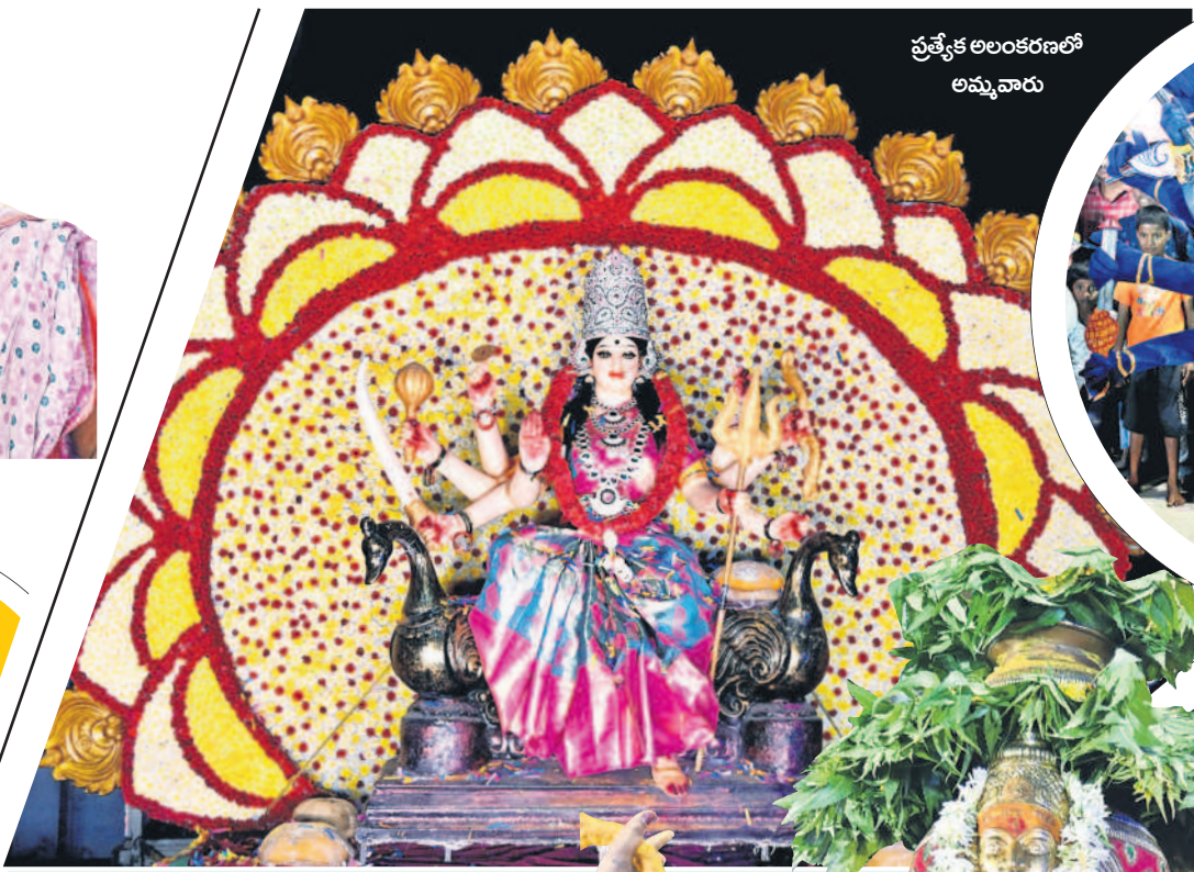
ప్రత్యేక అలంకరణలో అమ్మవారు