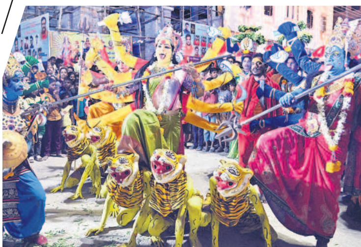
దేవీమాత వేషధారణలో కళాకారులు