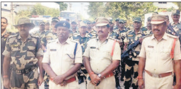
బోయినపల్లి: మండల కేంద్రంలో కవాతు చేస్తున్న కేంద్ర సాయుధ బలగాలు

బోయినపల్లి, అక్టోబర్ 25: మండల కేంద్రంలో బుద్ధవారం కేంద్ర సాయుధ బలగాలు కవాతు నిర్వహించాయి. అసెంబ్లీ ఎన్నికల నేపథ్యంలో పోలింగ్ ప్రశాంత వాతావరణంలో జరిపేందుకు కేంద్ర ఎన్నికల సంఘం పోలీస్ స్టేషన్లకు కేంద్ర సాయుధ బలగాలను పంపించింది. ఈ మేరకు కేంద్ర సాయుధ బలగాలు చేరుకుని బోయినపల్లి, కొదురుపాక, నీలోజపల్లి గ్రామాల్లో కవాతు నిర్వహించాయి. ఈ కవాతులో వేములవాడ డిఎస్పీ