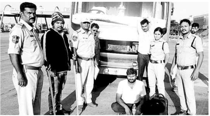
ట్రావెల్స్ లో వెండి తరలిస్తున్న వ్యక్తిని అదుపులోకి తీసుకున్న పోలీసులు