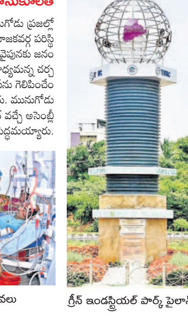
గ్రీన్ ఇండస్ట్రియల్ పార్క్ పైలాస్