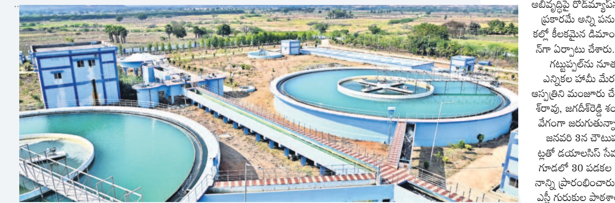
నాంపల్లి మండలం ఎన్డబ్ల్యూ లింగ్వింట్లలో ఏర్పాటు చేసిన మిషన్ భగీరథ ట్రీట్ మెంట్ ప్లాంట్