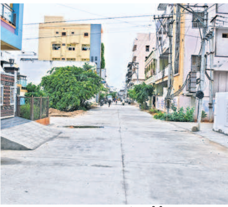
చౌటుప్పల్ పట్టణంలో వేసిన సీసీ రోడ్డు

రూ.3.68 కోట్లతో చేసే తక్కువ చేసే పరిశ్రమకు మునుగోడు నిలయం కాగా అందుకు అనుగుణంగా హ్యాండ్లమే క్షుద్ధ ఏర్పాటుపై మంత్రి కేసీఆర్ ప్రత్యేక శ్రద్ధ పెట్టారు. నారాయణపురం, గట్టుప్పల్, తెరవేపల్లిలో చేసే క్షుద్ధ ఏర్పాటు చేస్తున్నట్లు ప్రకటించి వెంటనే నిధులు మంజూరు చేశారు. గట్టుప్పల్ లో రూ.2.37 కోట్లతో, తెరవేపల్లిలో రూ.78 లక్షలతో, నారాయణపురంలో రూ.73 లక్షలతో క్షుద్ధ తొలి విడుదల 80 శాతం నిధులు విడుదల చేశారు. దాంతో మగ్గాల కొనుగోళ్లు, ఆసు యంత్రాలకు ఆర్డర్లు, ఇతర సామగ్రి సమకూర్చుకోవడంపై దృష్టి పెట్టారు. త్వరలోనే ఇవి పూర్తి స్థాయిలో అందుబాటులోకి రానున్నాయి.