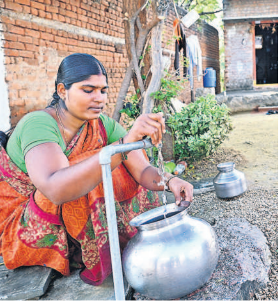
నాంపల్లిలో ఇంటి వద్ద భగీరథ నీళ్లు వదుతున్న మహిళ

సమైక్య పాలనలో మునుగోడు దుస్థితిని స్వయంగా చూసి చలించిపోయిన కేసీఆర్ స్వరాష్ట్రంలో ఏం చేస్తానో అనాడే చెప్పారు. 60 ఏండ్లలో ఫ్లోరైడ్ రక్తస్థి పైచేయి సాధించారు. బీజేపీ పాలకులకు చెంచెల్లు మనిషించేలా ఆరేండ్లలోనే ఫ్లోరైడ్ రక్తస్థి పైచేయి సాధించారు. ఇక్కడే టీకారం చుట్టిన మిషన్ భగీరథతో కొత్తగా ఒక్క ఫ్లోరైడ్ కేసు సమాధి కాలేదని పార్లమెంట్ సాక్షిగా కేంద్రమే ప్రకటించింది. ఇక డిండి తోపాటు శాశ్వత నివారణ చర్యల్లో డిండి ఎత్తిపోతల పథకం ద్వారా మునుగోడు నియోజకవర్గంలోని 2.55 లక్షల ఎకరాలకు సాగునీరు అందేలా చర్ల గూడెం, లక్కాజూపురం రిజర్వాయర్ నిర్మాణాలు ముగిసాయి. ఇక రహదారులు, గ్రామాల్లో మౌలిక వసతులు ఇలా అనేక రంగాల్లో మునుగోడు ప్రగతిభంధంలో సాగుతున్నది. అందుకే టీఆర్ఎస్ మునుగోడుకు మేలిమయమని ఇక్కడ ప్రజలు భావిస్తున్నారు. అసెంబ్లీ ఎన్నికలకు ఏడాది ముందే క్షేత్రస్థాయిలో ఉప ఎన్నికల్లో