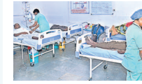
చౌటుప్పల్ ప్రభుత్వ దవాఖానలో డయాలసిస్ సేవలు

ప్రజల్లో సానుకూలత స్వరాష్ట్రంలో టీఆర్ఎస్ సర్కార్ చేసిన అభివృద్ధిపై మునుగోడు ప్రజల్లో సానుకూలత వ్యక్తమవుతున్నది. 2104 కంటే ముందు నియోజకవర్గ పరిస్థితిని, నేటి పరిస్థితులను బేరీజు వేసుకుంటూ టీఆర్ఎస్ వైపుకు జనం మొగ్గుచూపుతున్నారు. టీఆర్ఎస్ తోనే స్థిరమైన అభివృద్ధి సాధ్యమన్న చర్చ సర్వత్రా సాగుతున్నది. ఎన్నికలు ఎప్పుడొచ్చినా టీఆర్ఎస్ గెలిపించేందుకు ఇక్కడ ప్రజలు ఇప్పటికే మానసికంగా సిద్ధమయ్యారు. మునుగోడు ప్రజా ఆశీర్వాద సభ వేదిక మీదుగా టీఆర్ఎస్ అధినేత కేసీఆర్ వచ్చే అసెంబ్లీ ఎన్నికల్లోనూ తమకు తిరుగులేదని చాటిచెప్పేందుకు సిద్ధమయ్యారు.