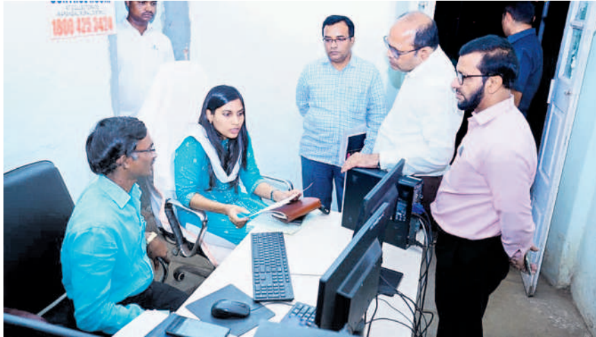
ఎన్నికల కంట్రోల్ రూమ్ కు వచ్చిన ఫిర్యాదులు, తీసుకున్న చర్యలపై తెలుసుకుంటున్న కలెక్టర్ ప్రావీణ్య

పోచమ్మమైదాన్, అక్టోబర్ 25: ప్రజల నుంచి వచ్చే ఫిర్యాదులను ఎప్పటికప్పుడు పరిష్కరించాలని జిల్లా ఎన్నికల అధికారి, కలెక్టర్ ప్రావీణ్య అధికారులను ఆదేశించారు. వరంగల్ కలెక్టరేట్ లోని ఎన్నికల కంట్రోల్ రూమ్ ను బుధ