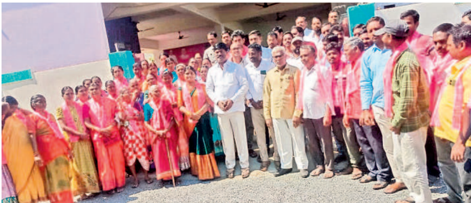
నర్సంపేట : బీఆర్ఎస్లో చేరిన పట్టణంలోని ఒకటి వార్డు కాంగ్రెస్ కార్యకర్తలకో నర్సంపేట ఎమ్మెల్యే అభ్యర్థి పెద్ది సుదర్శన్రెడ్డి