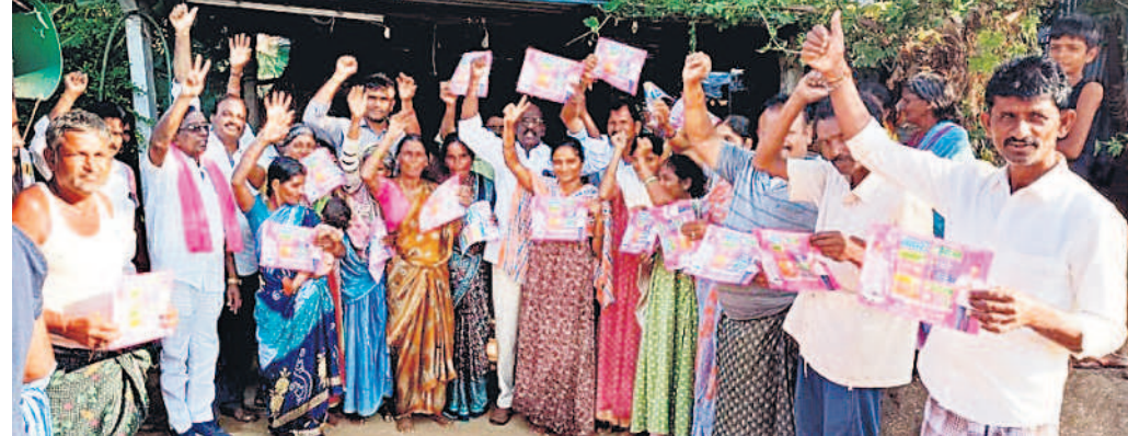
నర్సింహంపేట : గోపంకండ్రాలో ఇంటింటా ప్రచారం నిర్వహిస్తున్న బీఆర్ఎస్ జిల్లా నాయకుడు యాదగిరెడ్డి, నాయకులు