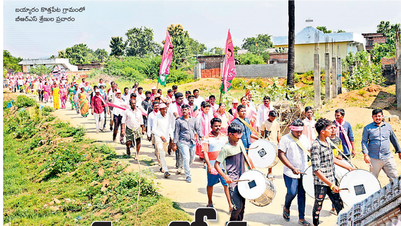
బయ్యారం కొత్తపేట గ్రామంలో బీఆర్ఎస్ శ్రేణుల ప్రచారం