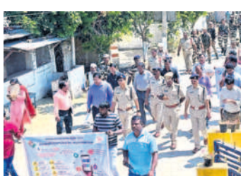
బీబీనగర్ : గూడూరులో కవాతు నిర్వహిస్తున్న పోలీసులు