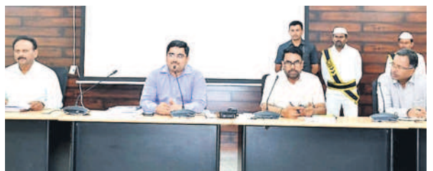
అధికారుల సమావేశంలో మాట్లాడుతున్న కలెక్టర్ హనుమంత్ కొండీబా

భువనగిరి కలెక్టరేట్ : నామినేషన్ల ప్రక్రియపై అవగాహన అవసరమని జిల్లా ఎన్నికల అధికారి, కలెక్టరు హనుమంత్ కొండీబా రిటర్నింగ్ అధికారులు, అసిస్టెంట్ రిటర్నింగ్ అధికారులకు సూచించారు. బుధవారం కలెక్టరేట్ కార్యాలయంలో అధికారులకు నామినేషన్ల పరిశీలన, ఫార్మ్ 7 ఏ దరఖాస్తు ప్రీవేరీషన్ పై శిక్షణ నిర్వహించారు. ఈ సందర్భంగా కలెక్టర్ మాట్లాడుతూ.. ఎన్నికల ప్రక్రియలో నామినేషన్ స్వీకరణ, వాటి పరిశీలన, ఉపసంహరణ వంటి అంశాలు కీలకమని, వాటిపై అవగాహన పెంపొందించుకోవాలన్నారు. నామినేషన్ల ప్రక్రియ కోసం చేయాల్సిన పనులు, రిటర్నింగ్ అధికారి కార్యాలయం కోసం ఏర్పాట్లు చేసుకోవాలని, ఏ సిబ్బంది ఏ పనులు చేయాలనేది ముందే నిర్ణయించుకోవాలని సూచించారు. నామినేషన్ వేసి అభ్యర్థి నామినేషన్ పరిశీలన రోజుకు 25 ఏండ్లు నిండి ఉండాలని, నామినేషన్ వేసాక అభ్యర్థితో ప్రమాణం చేయించాలని, ప్రమాణం చేసినట్లుగా ధ్రువీకరణ పత్రం ఇవ్వా