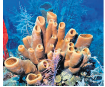
ఉదా: యుష్కెల్లా, సైకాన్, స్పాంజిల్లా