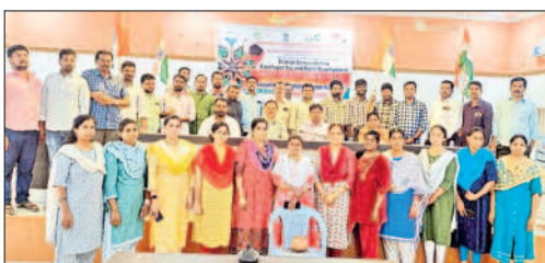
మేరా మట్టి మేరా దేశ్ కార్యక్రమంలో పాల్గొన్న అధికారులు