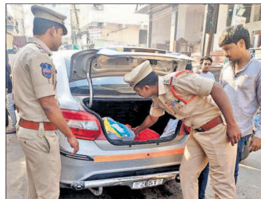
తలాబేకట్ట వద్ద వాహనాలను తనిఖీ చేస్తున్న ఎన్ఐఐ దామోదర్, సిబ్బంది

చార్మినార్, అక్టోబర్ 26 : ప్రజలు అధిక మొత్తంలో నగదు, బంగారం తరలించే సమయంలో తగిన ఆధార పత్రాలు వెంట తీసుకుని ప్రయాణించాలని భవానీనగర్ ఎన్ఐఐ దామోదర్ తెలిపారు. గురువారం ఆయన భవానీనగర్ పోలీస్ స్టేషన్ పరిధిలోని తలాబేకట్ట వద్ద ఆయన సిబ్బందితో కలిసి వాహనాల తనిఖీ చేపట్టారు. ఈ సందర్భంగా ఎన్ఐఐ దామోదర్ మాట్లాడుతూ ఎన్నికల నియమావళి అమల్లోకి వచ్చిన తరువాత డబ్బుతో ఓటర్లను ప్రలోభాలకు గురి చేయడానికి రాజకీయ నేతలు నగదు పంపిణీకి ప్రయత్నిస్తుంటారని పేర్కొన్నారు. అరికట్టేందుకు వాహనాల తనిఖీ చేపడుతున్నట్లు తెలిపారు. అధికారాలు లేకుండా నగదు తరలించే వారిపై నిఘా కొనసాగిస్తున్నామన్నారు. అధిక మొత్తంలో నగదు తరలించే సమయంలో తగిన ఆధారాలు భద్రపర్చుకుని ప్రయాణించాలని, లేకుంటే స్వాధీనం చేసుకుని ఐటీ అధికారులకు అందజేస్తామని తెలిపారు. సరైన పత్రాలను అధికారులకు చూపించి ఆ మొత్తాలను తిరిగి అందుకోవచ్చని ఆయన పేర్కొన్నారు.