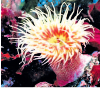
అంటారు. ప్రాథ జీవితో కూడా రెండు పొరలే ఉంటాయి.