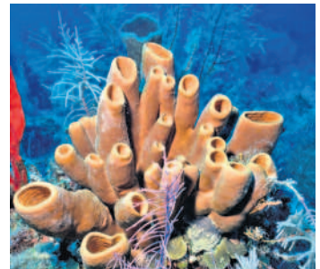
ఉదా: యుష్కైల్లా, సైకాన్, స్పాంజిల్లా