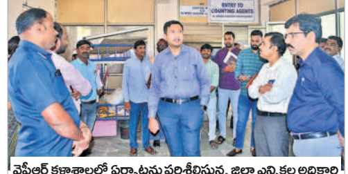
వైపిఆర్ కళాశాలలో ఏర్పాట్లను పరిశీలిస్తున్న జిల్లా ఎన్నికల అధికారి