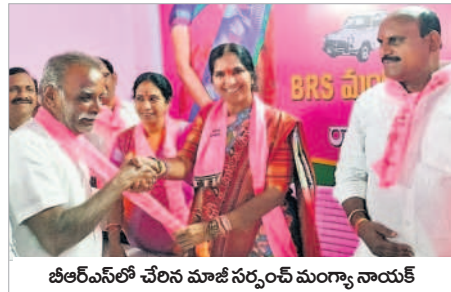
బీఆర్ఎస్ లో చేరిన మాజీ సర్పంచ్ మంగ్యనాయక్

రామాయంపేట, అక్టోబర్ 26 : తెలంగాణలోని ప్రతి ఇంటికీ బీఆర్ఎస్ ప్రభుత్వం అమలు చేసిన సంక్షేమ పథకాలు చేరాయని, ప్రజా సంక్షేమమే సీఎం కేసీఆర్ లక్ష్యమని మెడక్ ఎమ్మెల్యే పద్మాదేవేందర్ రెడ్డి అన్నారు. ప్రజలకు ఇస్తున్న సంక్షేమ పథకాలను నిలిపివేయాలని ఎన్నికల కమిషన్ ను కాంగ్రెస్ కోరడంతో ఆ పార్టీ నైజాం బయటపడిందన్నారు. కాంగ్రెస్ పార్టీకి ప్రజల సంక్షేమ పట్టదని విమర్శించారు. మూడోసారి బీఆర్ఎస్ అధికారంలోకి వస్తుందన్నారు. గురువారం రామాయంపేట పట్టణంలో బీఆర్ఎస్ పార్టీ (రూరల్) కార్యాలయాన్ని ప్రారంభించారు. ఈ సందర్భంగా ఎమ్మెల్యే పద్మాదేవేందర్ రెడ్డి మాట్లాడారు. రాష్ట్ర ప్రజలంతా బీఆర్ఎస్ వైపు ఉన్నారని, అసెంబ్లీ ఎన్నికల్లో తనను భారీ మెజార్టీతో గెలిపిస్తే మీకు అండగా ఉంటానన్నారు. బీఆర్ఎస్ పార్టీ చేస్తున్న ప్రజాకర్షక పథకాలకు ఆకర్షితులై కాంగ్రెస్, బీజేపీ కార్యకర్తలు బీఆర్ఎస్ లో చేరుతున్నట్లు తెలిపారు. రామాయంపేట మండలం రాయలపూర్, కాటియాల, లక్కాపూర్ గ్రామాలకు చెందిన సుమారు 200 మంది బీఆర్ఎస్ లో చేరారు. కాంగ్రెస్ నేతలకు కండ్లు ఉన్నా ఎదురుగా కనిపి