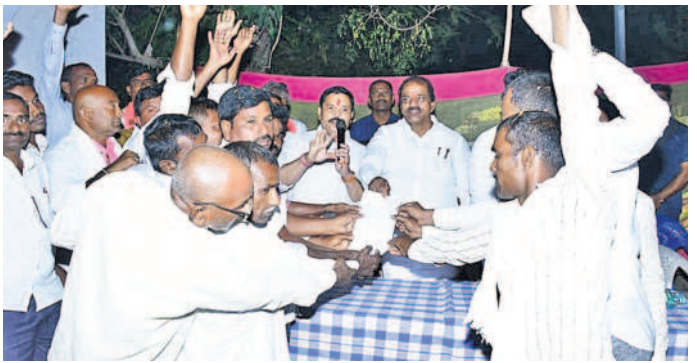
సిర్సాపూర్ : గోసాయిపల్లిలో మద్దతు ఇస్తున్న తిర్నాన పల్లాన్ని ఎమ్మెల్యేకు అందజేస్తున్న నేతలు