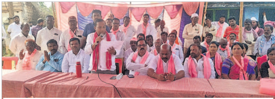
జహీరాబాద్ : కొత్తూర్(బి) గ్రామంలో ఏర్పాటు చేసిన ఎన్నికల ప్రచార సభలో మాట్లాడుతున్న ఎమ్మెల్యే మాణిక్రావు