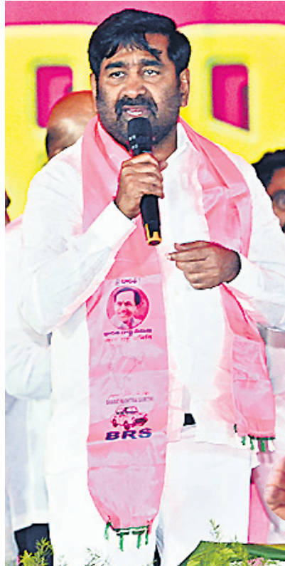
ప్రజా ఆశీర్వాద సభలో ప్రసంగిస్తున్న మంత్రి గుంటకండ్ల జగదీశ్ రెడ్డి

ప్రజా ఆశీర్వాద సభకు తరలివచ్చిన జనం.. సీఎం కేసీఆర్ ప్రసంగానికి చప్పట్ల మోత