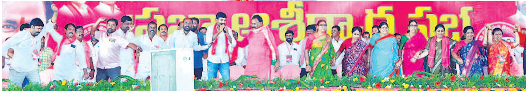
మునుగోడు ప్రజా ఆశీర్వాద సభలో ధూంధూం జోష్