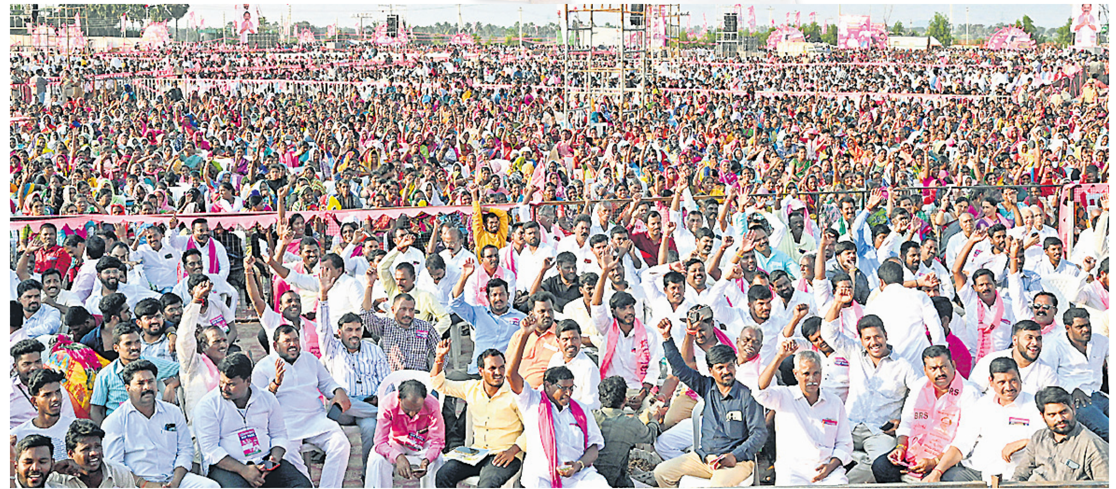
మునుగోడు ప్రజా ఆశీర్వాద సభకు పెద్ద సంఖ్యలో హాజరైన బీఆర్ఎస్ శ్రేణులు, ప్రజలు