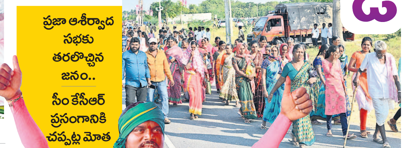
ప్రజా ఆశీర్వాద సభకు తరలివస్తున్న జనం

మునుగోడులో గురువారం సాయంత్రం నిర్వహించిన బీఆర్ఎస్ ప్రజా ఆశీర్వాద సభ గ్రాండ్ సక్సెస్ అయ్యింది. నియోజకవర్గం నలుమూలల నుంచి పొద్ది శ్రేణులు, ప్రజలు స్వచ్ఛందంగా పెద్ద సంఖ్యలో తరలివచ్చారు. బీఆర్ఎస్ జెండాలు, ఫ్లెక్సీలతో ఆ ప్రాంతమంతా గులాబీమయమైంది. ముఖ్యమంత్రి కేసీఆర్ రాక ఆలస్యమైనా వేచి చూసిన జనం.. బీఆర్ఎస్ అభినేతకు కులలు, చప్పట్లతో ఘన స్వాగతం పలికారు. ఆయన ప్రసంగానికి జేజేలు పలికారు. సీఎం ప్రసంగం ప్రజలు, పొద్ది శ్రేణుల్లో ఉత్సాహం నింపింది. సభ విజయవంతం కావడంతో బీఆర్ఎస్ శ్రేణుల్లో కొత్త జోష్ నెలకొంది.